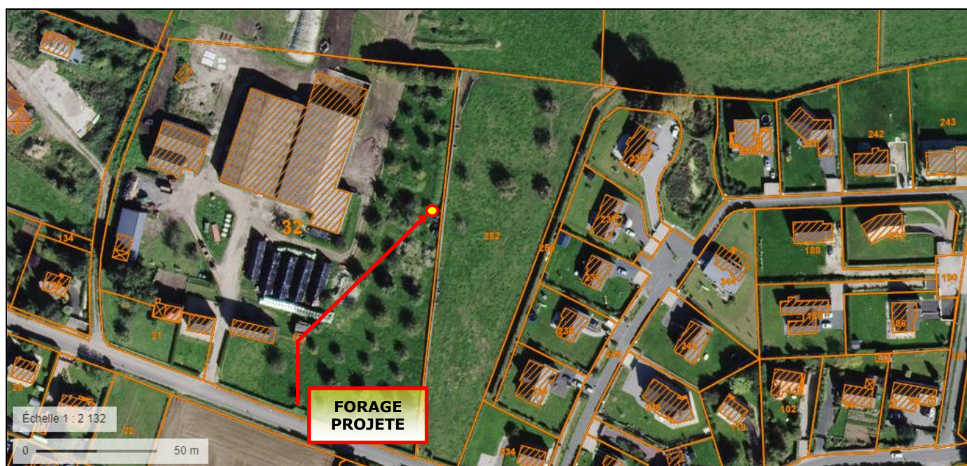
Situation cadastrale du forage projeté par M r Nicolas LEGROS au GROS CHÊNE (ISNEAUVILLE – 76)