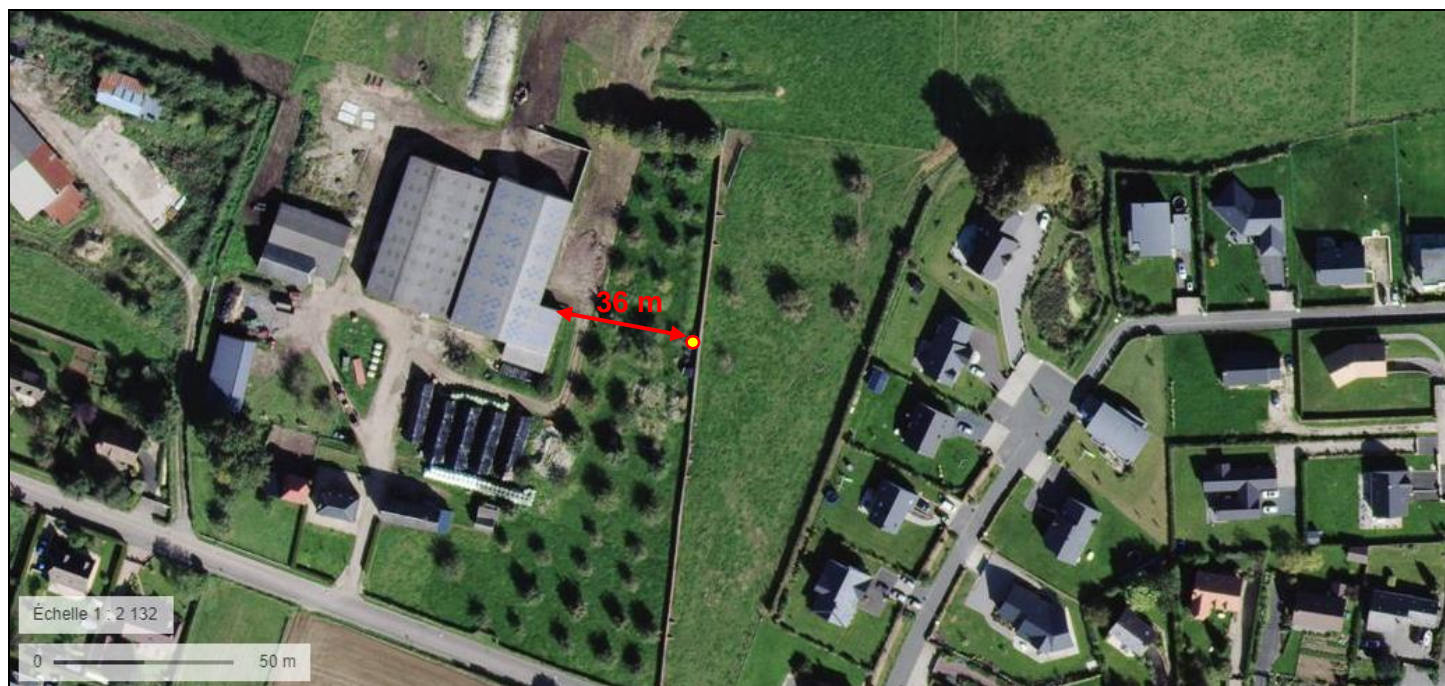
Situation du forage projeté par M r Nicolas LEGROS au GROS CHÊNE (ISNEAUVILLE – 76) sur photographie aérienne de l'IGN (Extrait du site : geoportail.gouv.fr )