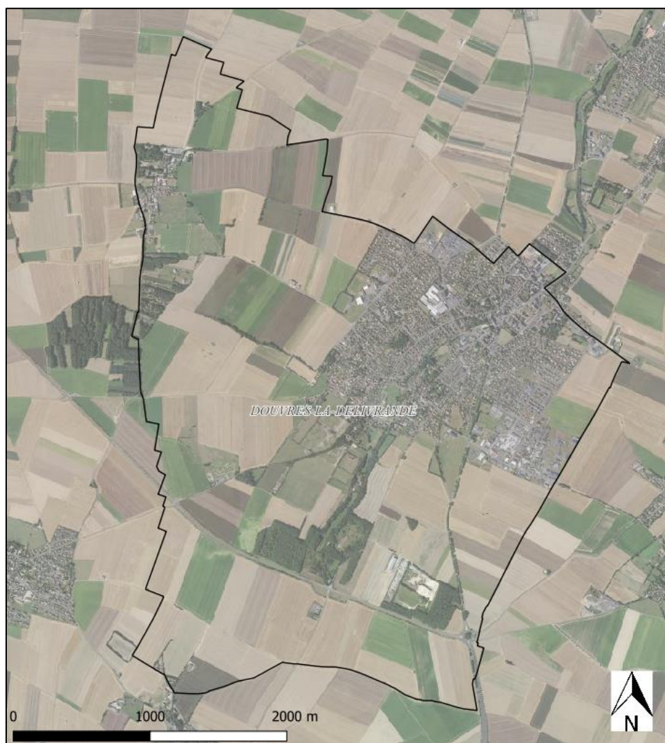
Figure 2 : Photographie aérienne de la commune de Douvres-la-Délivrande