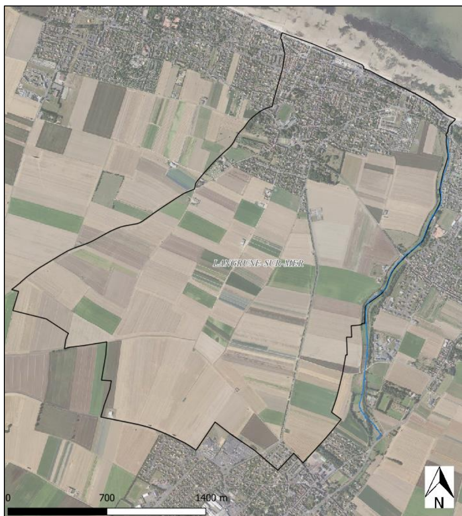
Figure 2 : Photographie aérienne de la commune de Langrune-sur-Mer