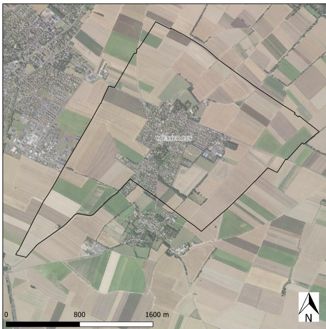
Figure 2 : Photographie aérienne de la commune de Cresserons