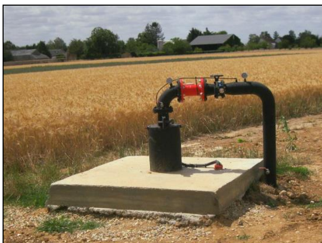
Exemple d'aménagement de tête de forage dédié à l'irrigation de cultures