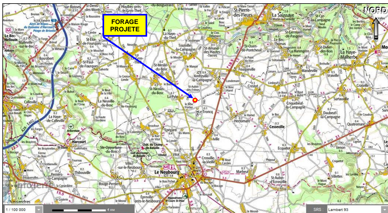
Situation du forage projeté par l'E.A.R.L. HEUGHEBAERT Danièle et Philippe au lieu-dit de LA VIEILLE MARNIERE (LE TRONCQ - 27) sur un extrait de carte géographique de l'IGN à 1/100 000°