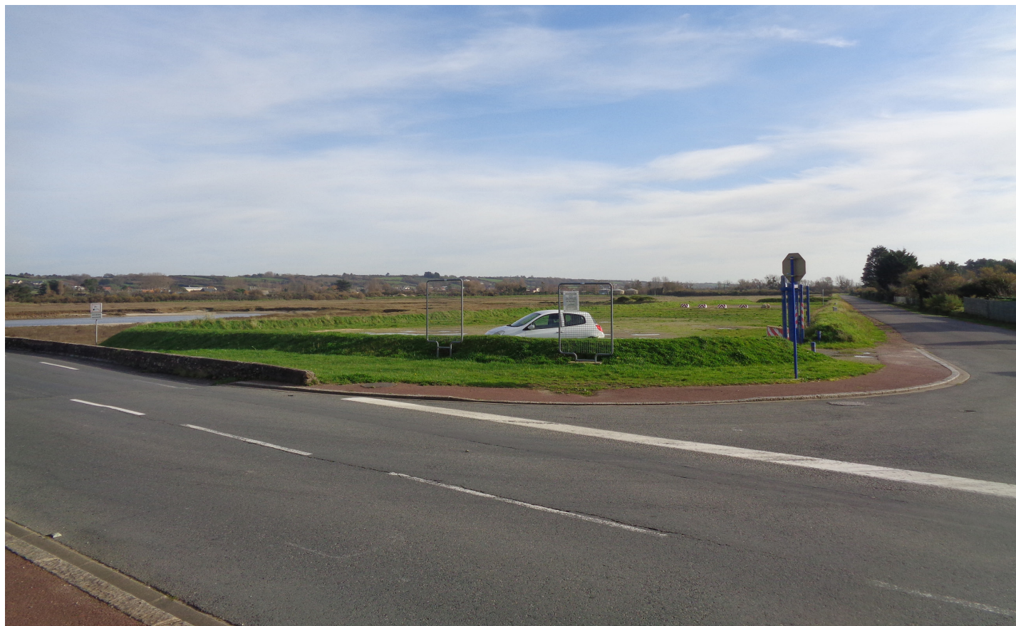
PHOTOGRAPHIE 1 - À L'ANGLE DE L'AVENUE DE LA MER ET DE L'AVENUE DES BOSQUETS - 24 NOVEMBRE 2020