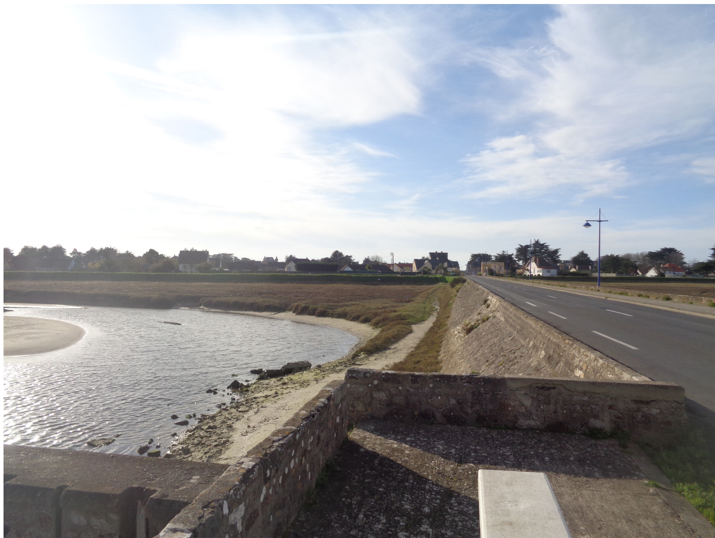
PHOTOGRAPHIE 3 - DEPUIS L'AVENUE DE LA MER - 24 NOVEMBRE 2020