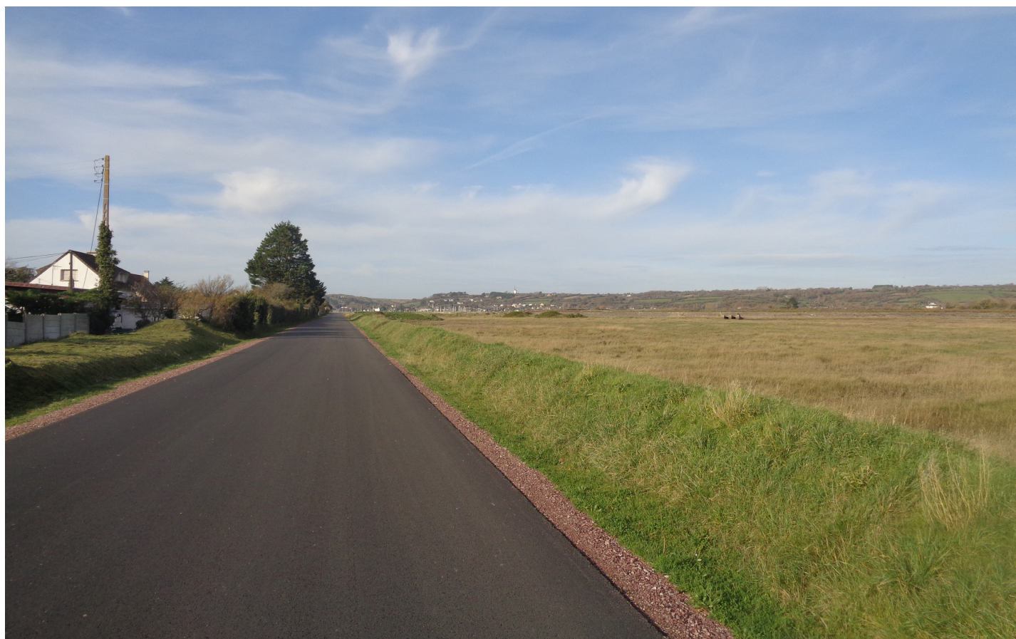
PHOTOGRAPHIE 2 - DEPUIS L'AVENUE DES BOSQUETS - 24 NOVEMBRE 2020