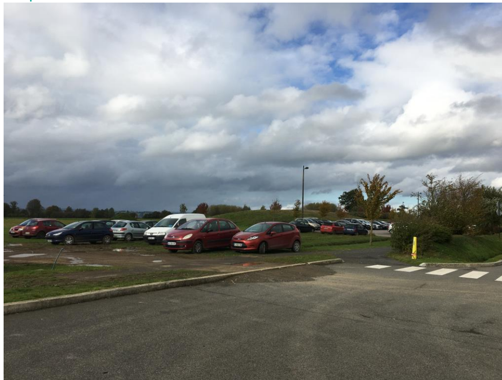
Stationnement sauvage sur l'emprise du site de projet – photographie 21/10/2020