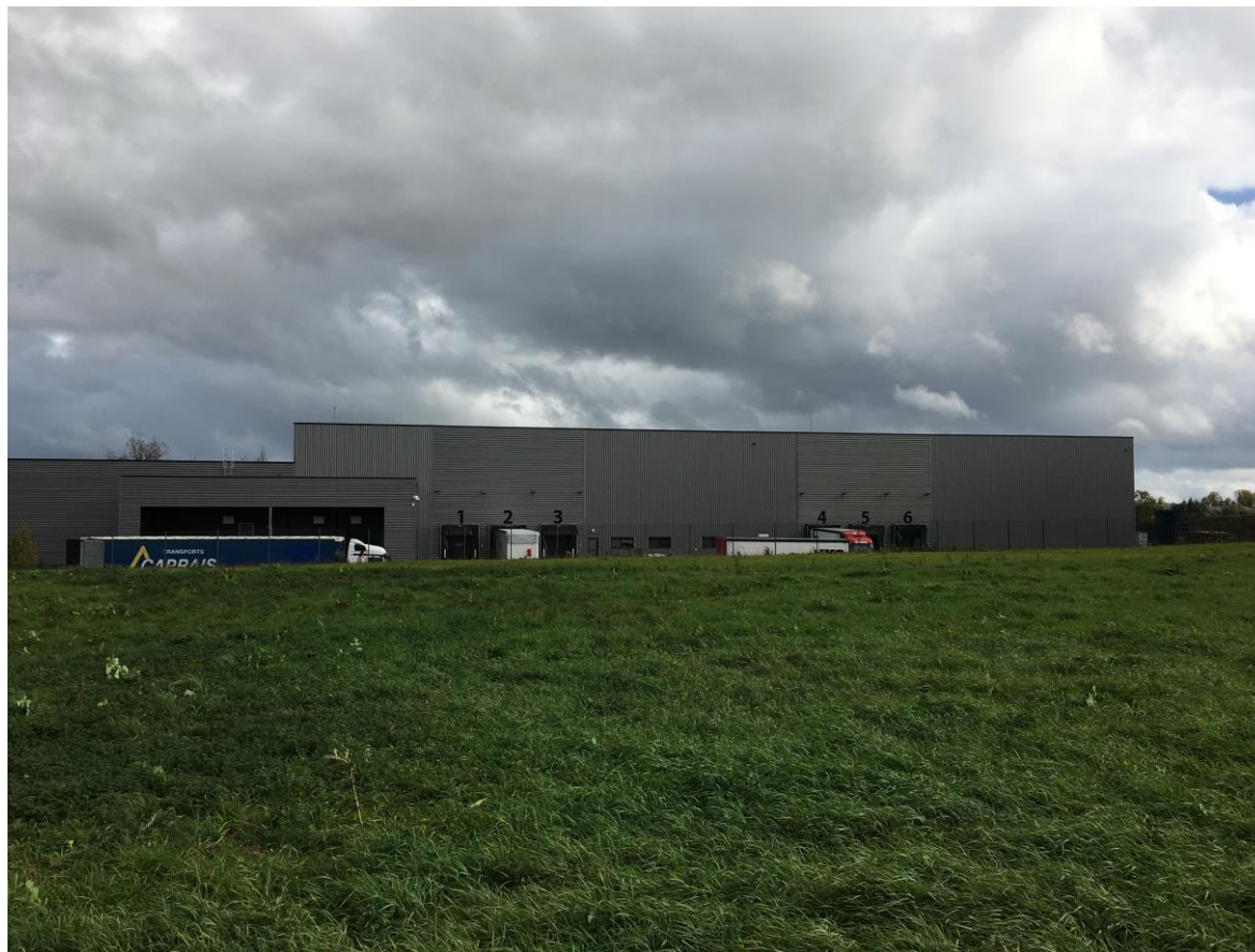
Bâtiment de l'entreprise LEMOINE – photographie 21/10/2020