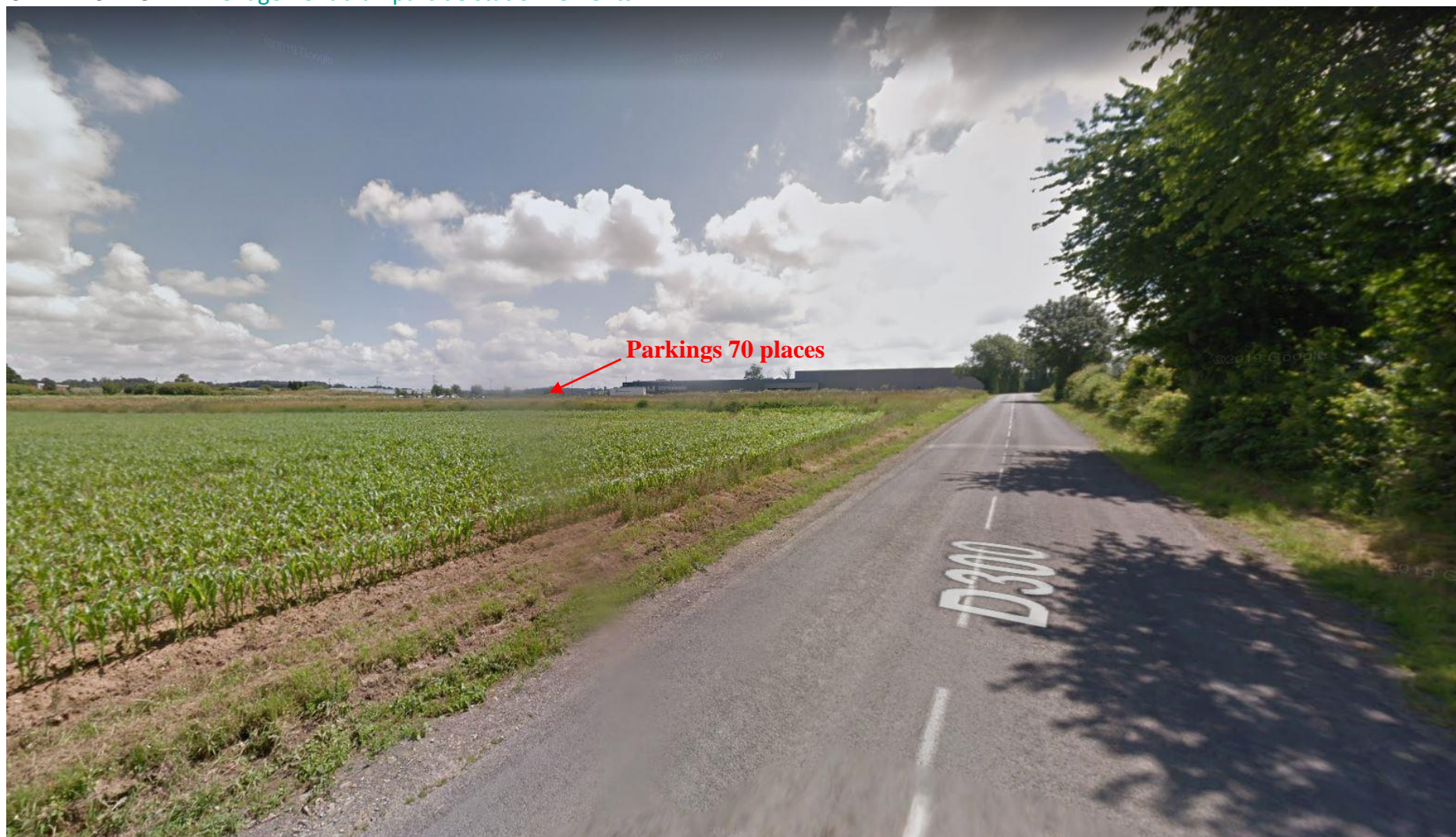
Vue du site par la RD300 venant de Caligny – prise de vue juin 2018