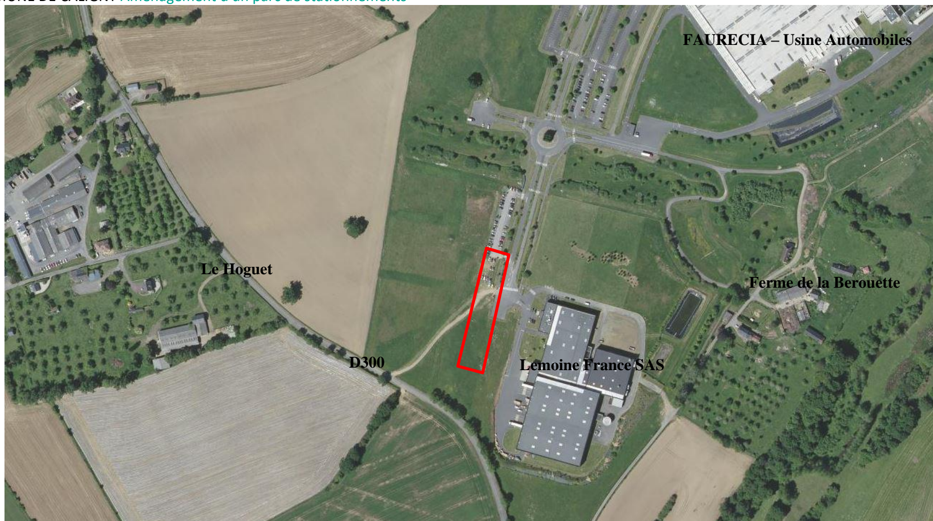
Vue aérienne générale du projet dans le contexte local – sans échelle