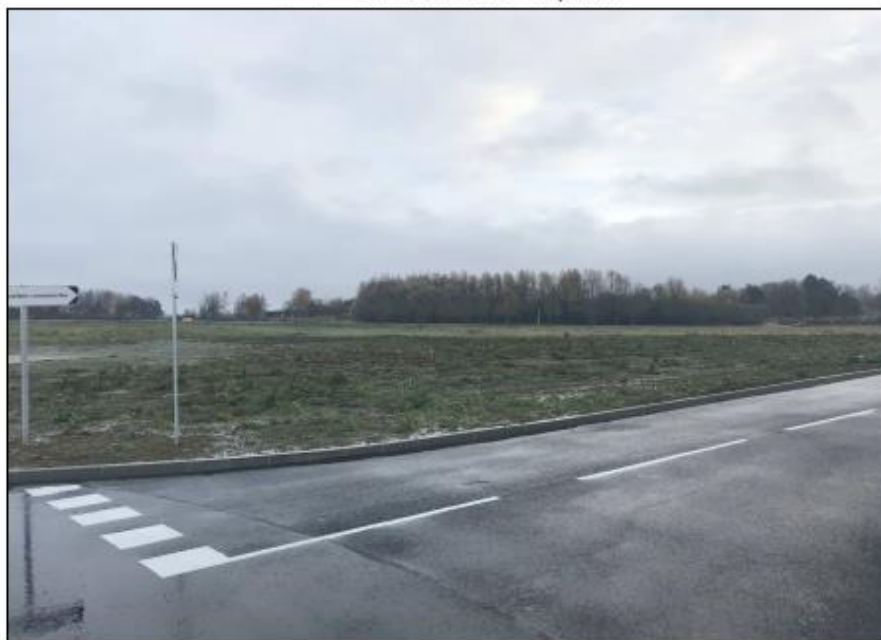
VUE PROCHE - Repère 2