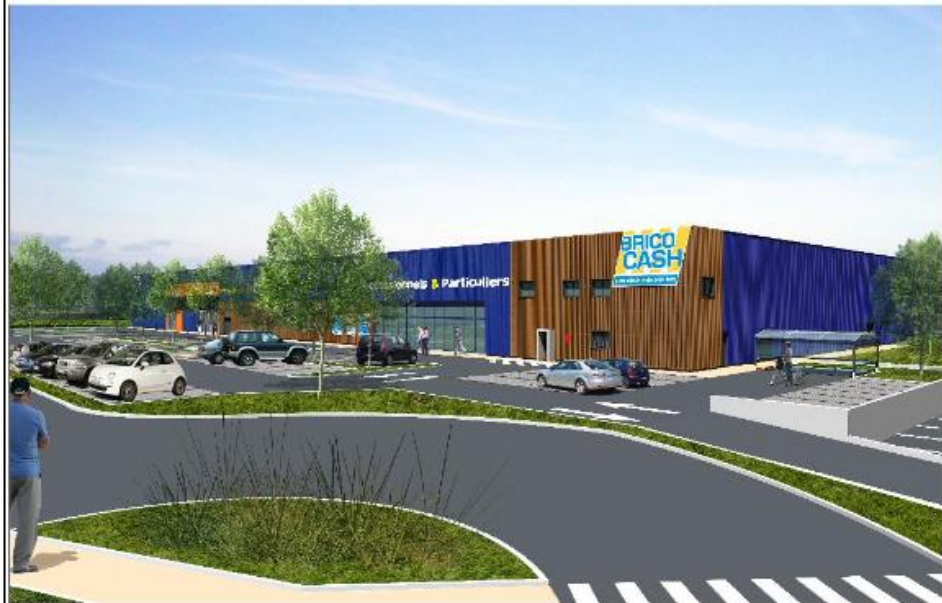
Insertion 2 - Vue piétonne