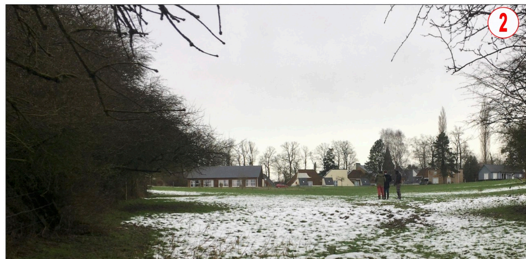
Situation du terrain dans l'environnement proche