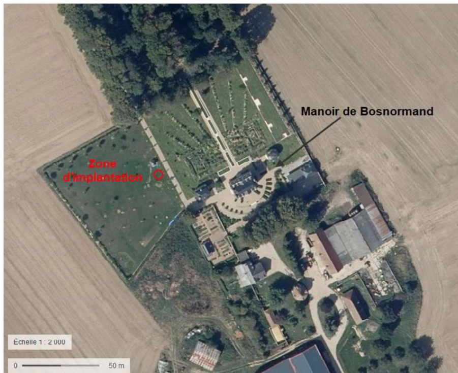
Figure 4: Cliché datant du 23/08/19 montrant l'environnement lointain du futur forage