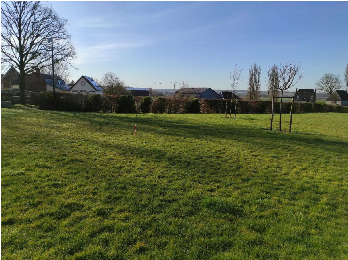
Figure 3: Cliché datant du 29/03/21 montrant l'environnement proche du futur forage (piquet avec rubalise)