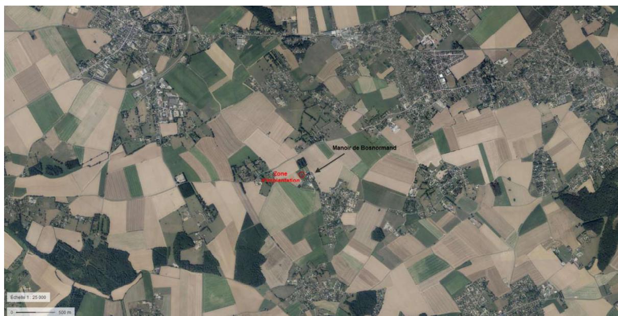
Figure 2: Plan de situation sur fond orthophotos