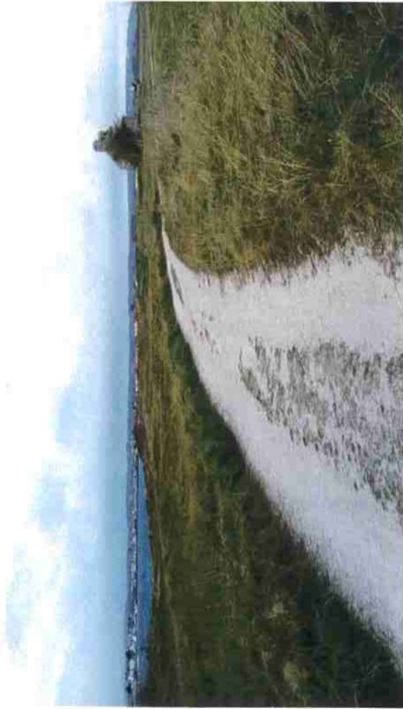
Photo 3 : chemin le long duquel une clôture de mise en défens sera installée pour protéger la pelouse aérohaline (à gauche sur la photo)