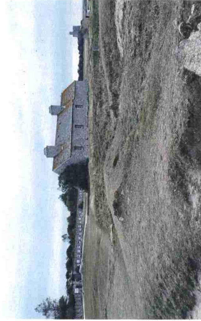
Photo 1 : vue sur la maison des douaniers et l'entrée du Lazaret depuis l'embarcadere