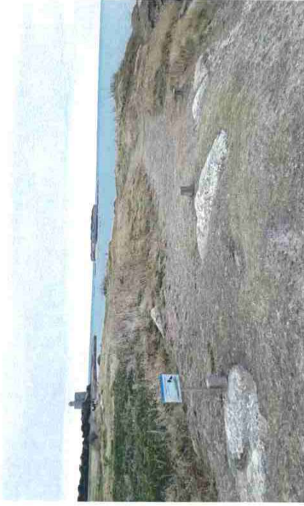
Photo 4 : départ de sentier spontané traversant la pelouse aérohaline qui sera fermé par une clôture