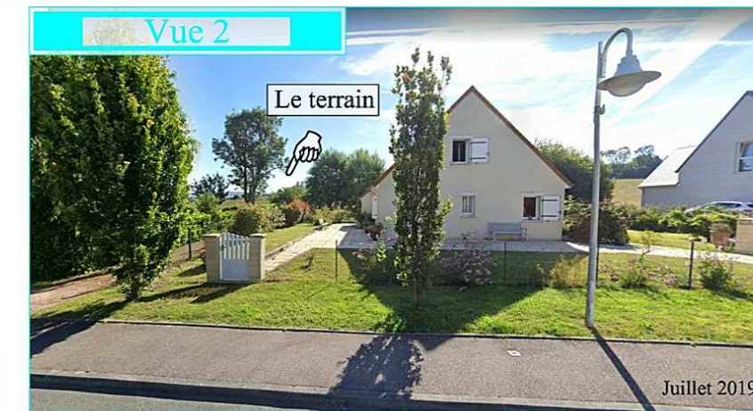
Le clos des champs Rabats