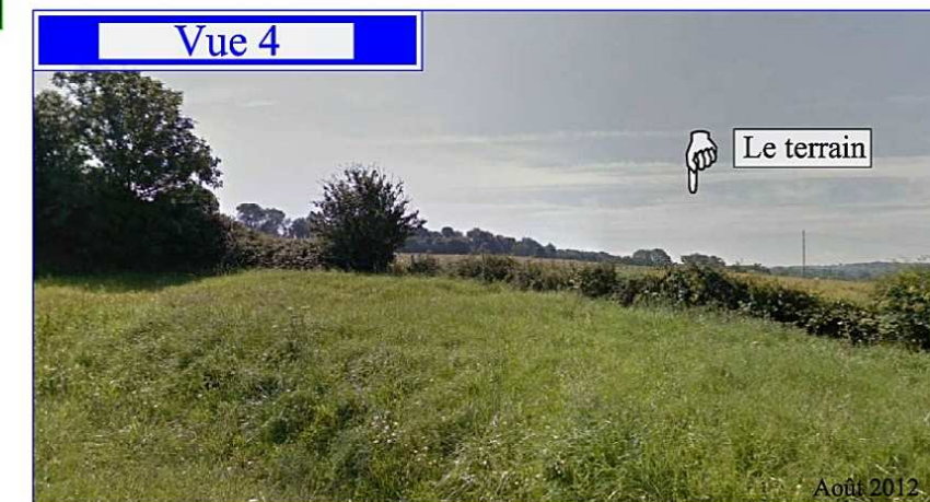
Chemin de la Bergerie