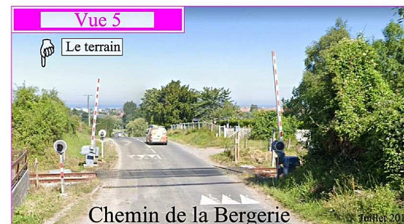
Chemin de la Bergerie