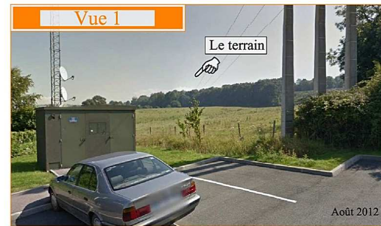
Le clos des champs Rabats