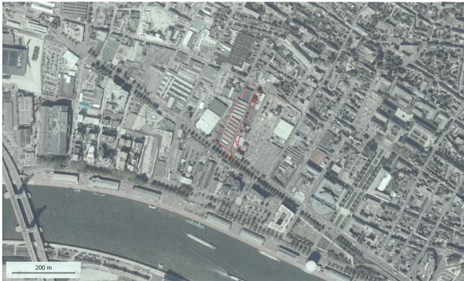
Plan de localisation 1/10000 ème