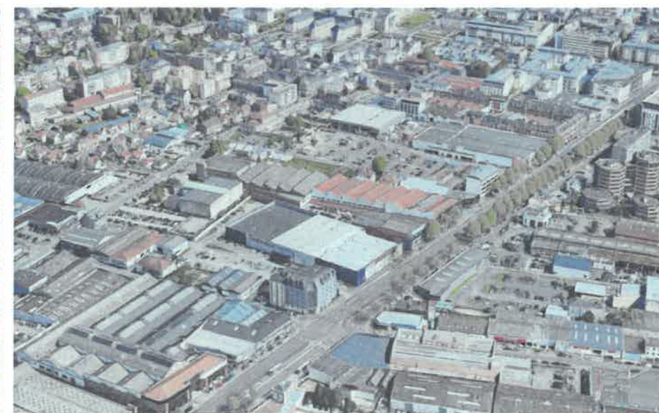
Prises de vues dans l'environnement lointain