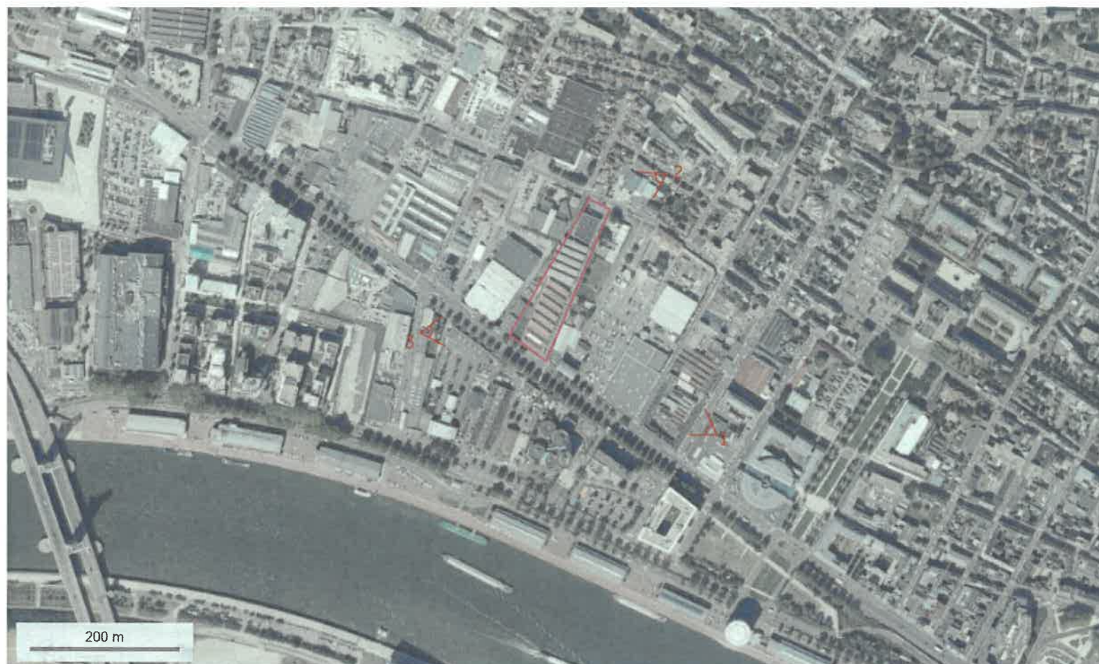
Plan de localisation 1/10000 ème