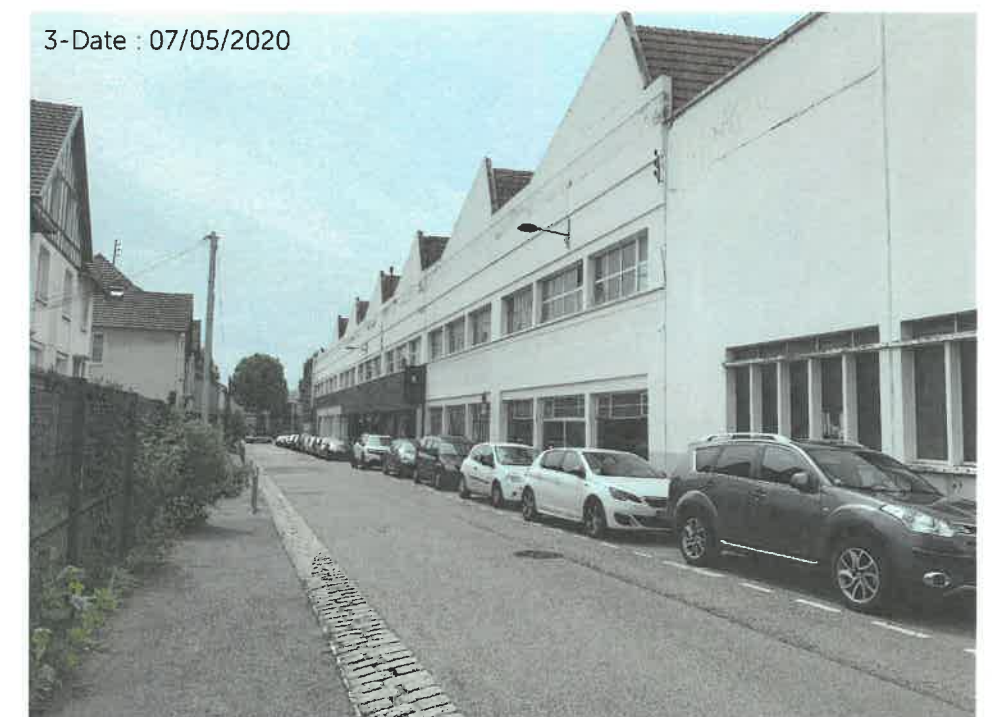
Prises de vues dans l'environnement proche