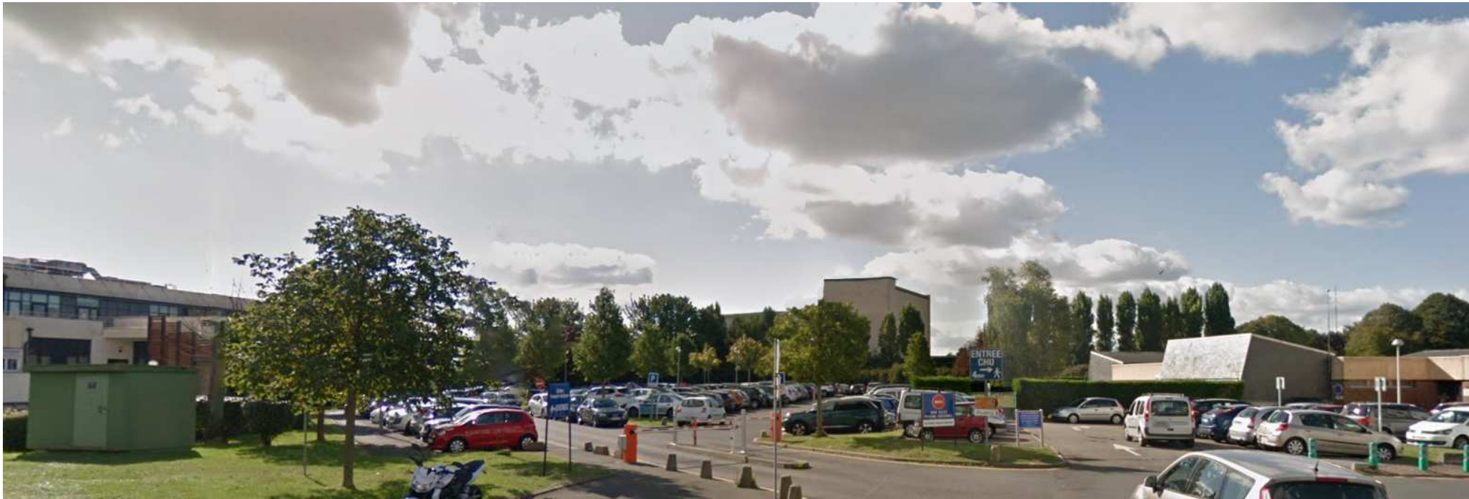
Photographie situant le projet dans son environnement proche 12/09/2019