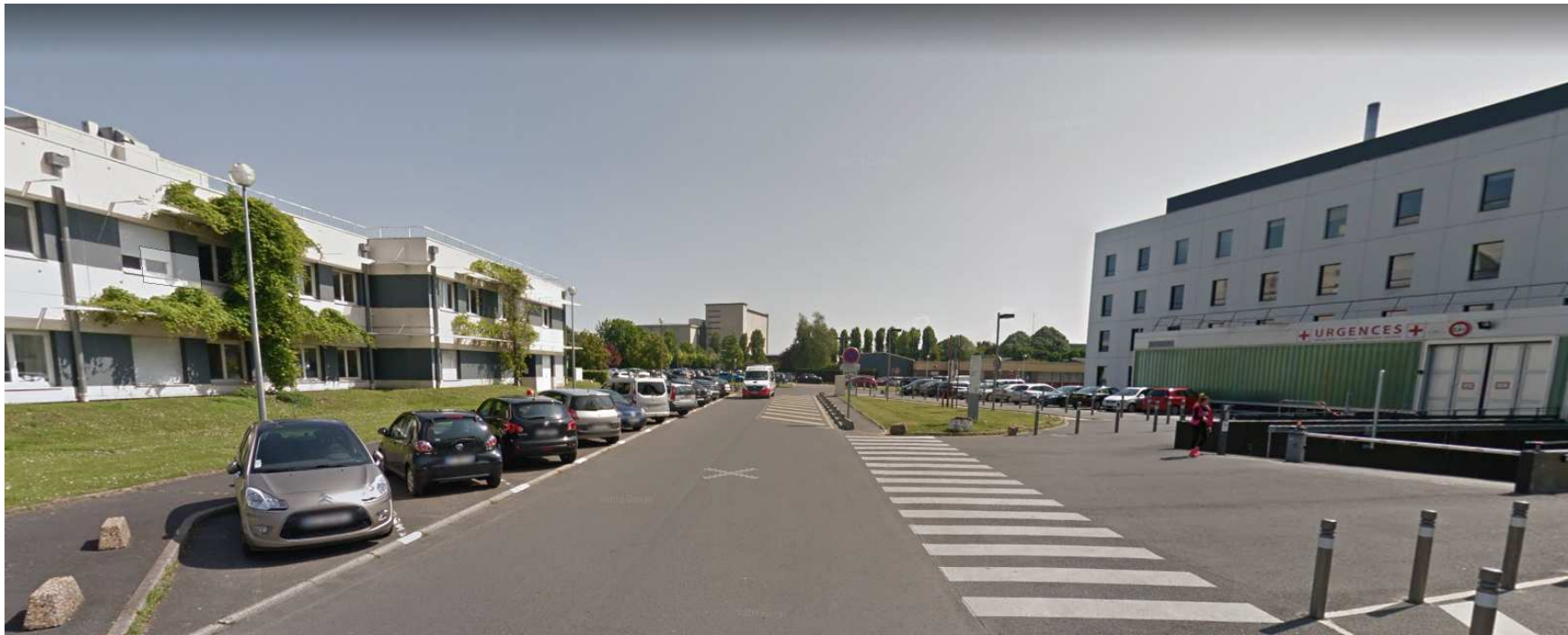
Photographie situant le projet dans son environnement lointain 12/09/2019