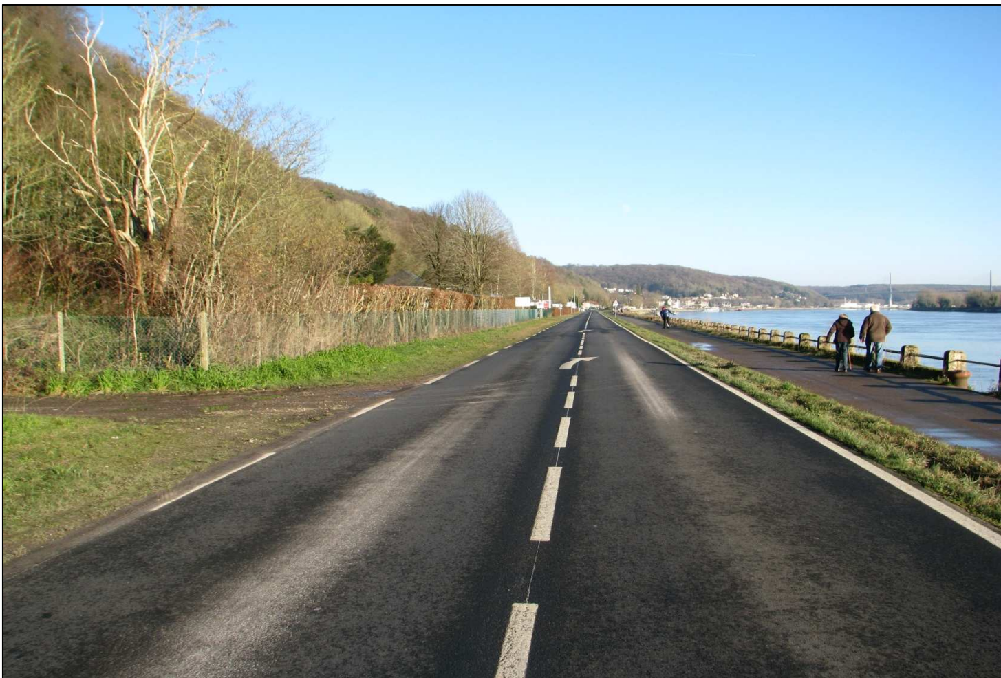
Photo 2 du plan de localisation (vue vers l'amont). Au 1 er plan la RD 81, la noue, la piste cyclable et le muret en crête de l'ouvrage. Au loin, Caudebec-en-Caux et le pont de Brotonne