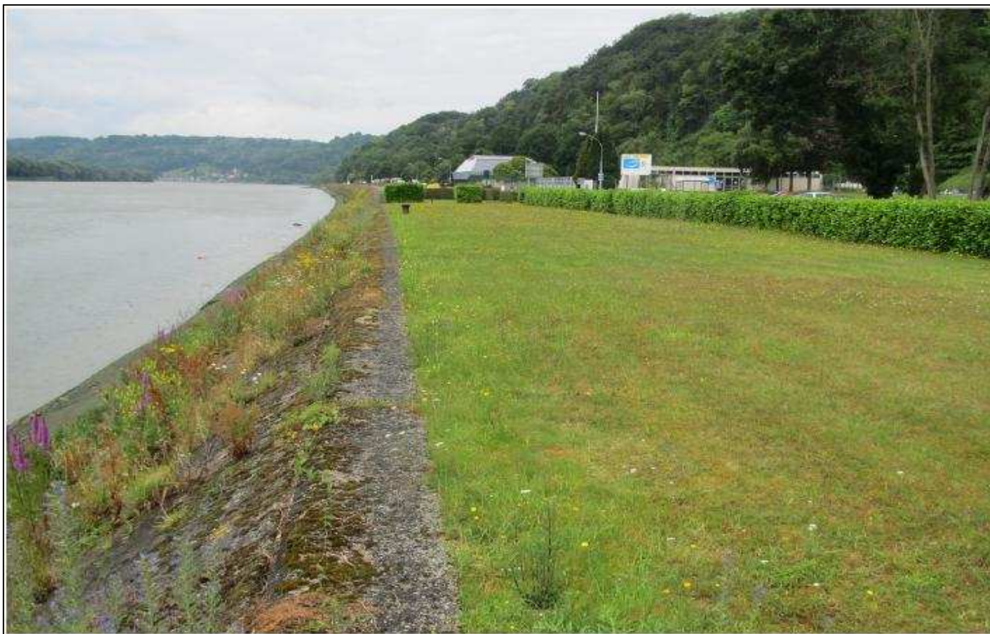
Photo 1 du plan de localisation (vue vers l'aval). Au 1 er plan, de la gauche vers la droite : perré en Seine concerné par les futurs travaux, terrain communal de Rives-en-Seine pressenti pour accueillir la base vie du chantier.

Au loin, piscine municipale et salle de sport surplombées du coteau boisé.