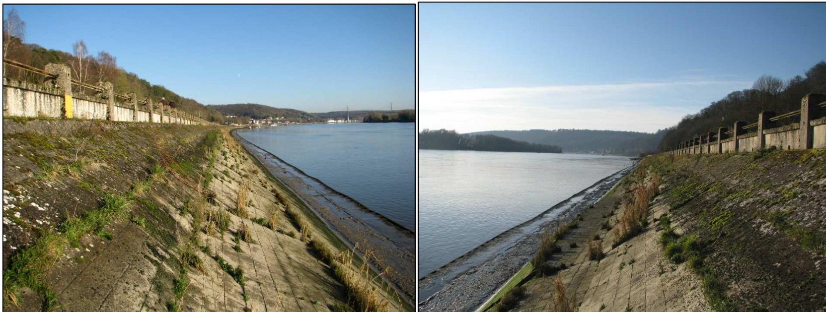
Photos 3 . Vues amont et aval du perré montrant la risberme (replat) et le rideau de palplanches, le parement en pierres maçonnées et le muret équipé d'un garde-corps.