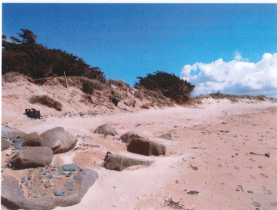
Prise de vue depuis la plage au pied de l'enrochement, 9 mai 2019