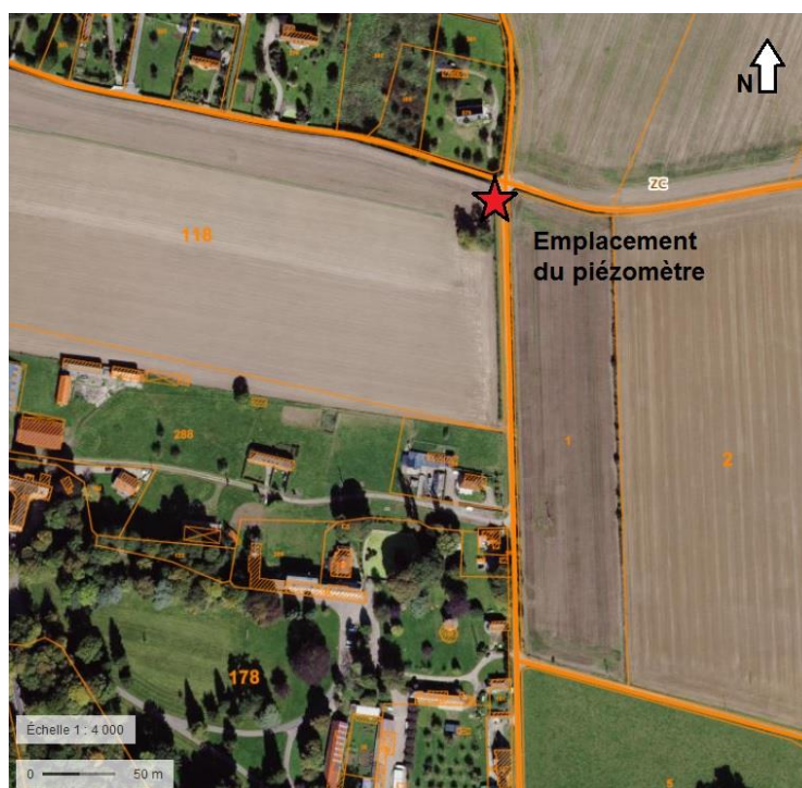
Illustration 2 : Localisation de la parcelle retenue sur fond cadastral et photographie aérienne