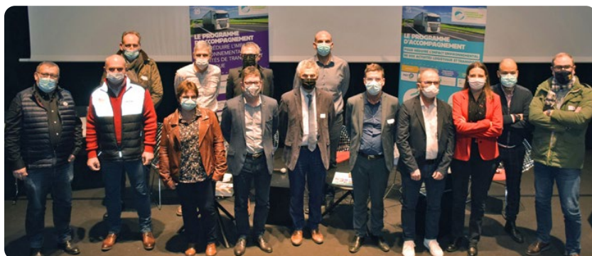
Photos des signataires présents lors de cérémonie de signature de la charte CO2, le 09 décembre 2021.

Ils pourraient permettre d'économiser sur 3 ans près de 23 000 tonnes de CO2 équivalent.