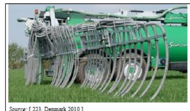
Source: [ 223 ,Denmark 2010 ]