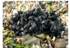
Ponte de seiche

À quel moment et où ont lieu les échouages de vélelles arrivant généralement au printemps, mais pouvant arriver plus tard en raison du changement climatique ? et les pontes de calmar ou de seiche ?