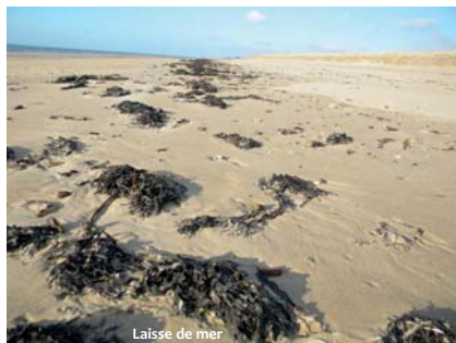
Laisse de mer

Cette lettre semestrielle rend compte d'actions menées sur ces thématiques par le CPIE du Cotentin ou par d'autres acteurs et vise aussi à diffuser des connaissances naturalistes, techniques ou scientifiques sur ces milieux et leur gestion.