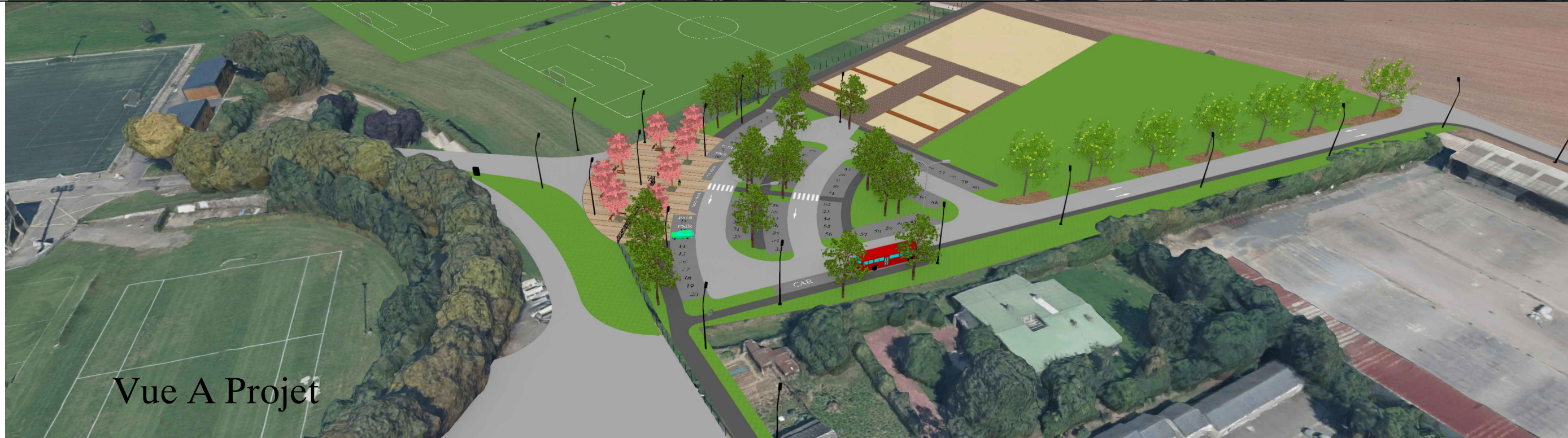
Vue A Projet