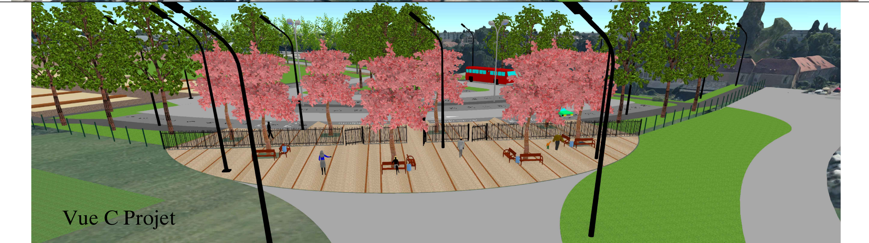
Vue C Projet