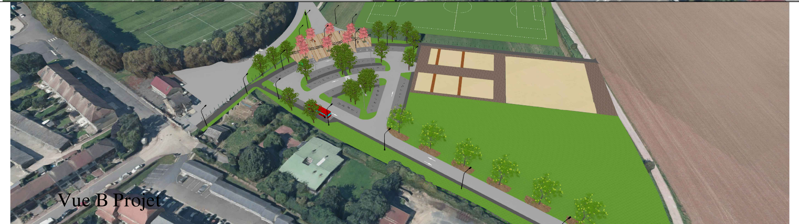
Vue B Projet