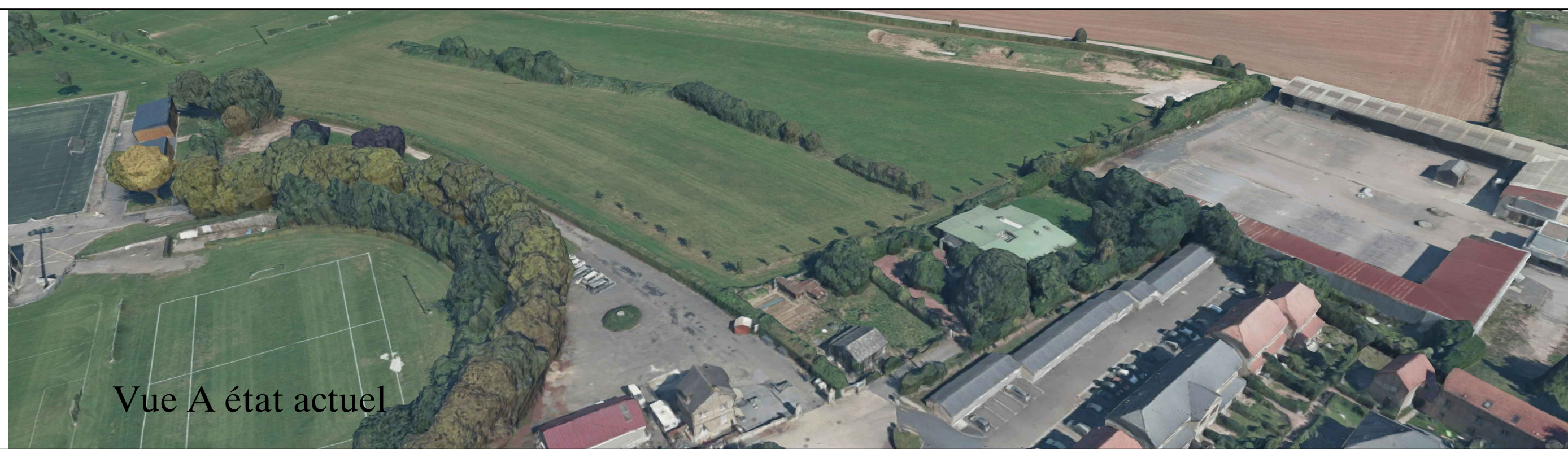
Vue A état actuel