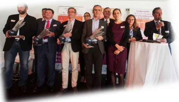
Remise des trophées Edition 2017 (Trophées sculptés par un artiste local)

La 3 ème édition des Trophées normands a eu lieu en 2017, et tous les dossiers déposés sont valorisés dans une brochure :