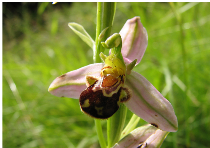
Ophrys abeille ( Ophrys apifera )

Vous avez repéré une zone naturelle prometteuse en matière de biodiversité et vous voudriez qu'elle soit connue et prospectée, pour peut-être bénéficier d'une reconnaissance en ZNIEFF et, partant, d'une certaine protection ? Il faudra dans un premier temps vérifier si cette zone n'est pas déjà en ZNIEFF.