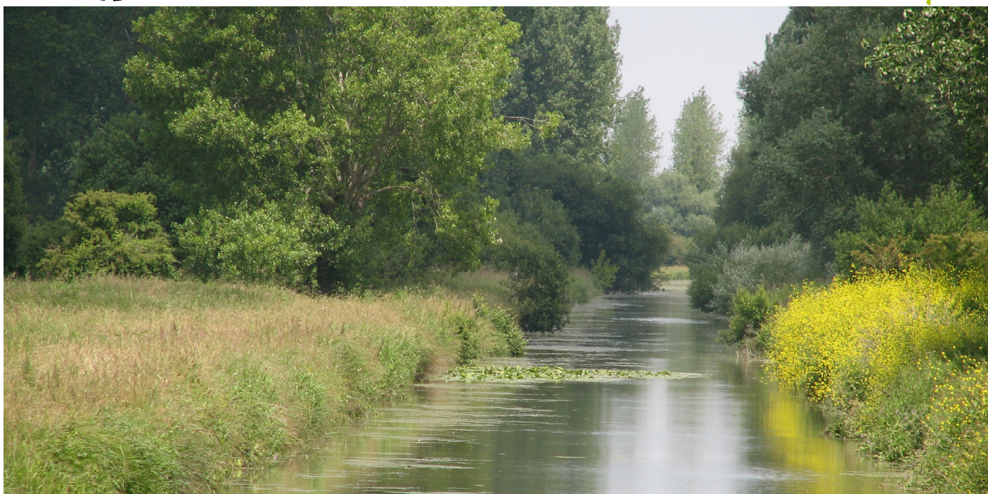
Marais de Robehomme (14)