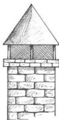
Illustration : L. Mendès