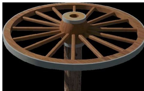
type « roue de charrette »