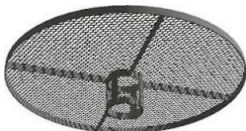
type « espagnol »

Exemples de plateforme sur poteau artificiel béton bois ou métal :