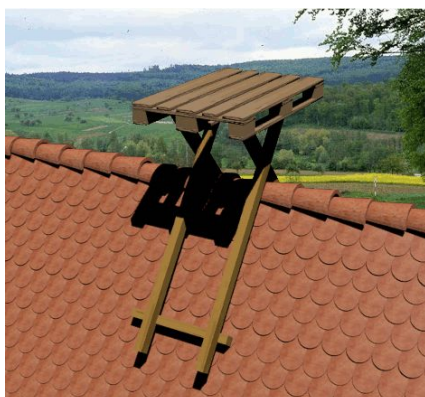
plateforme bois sur toiture