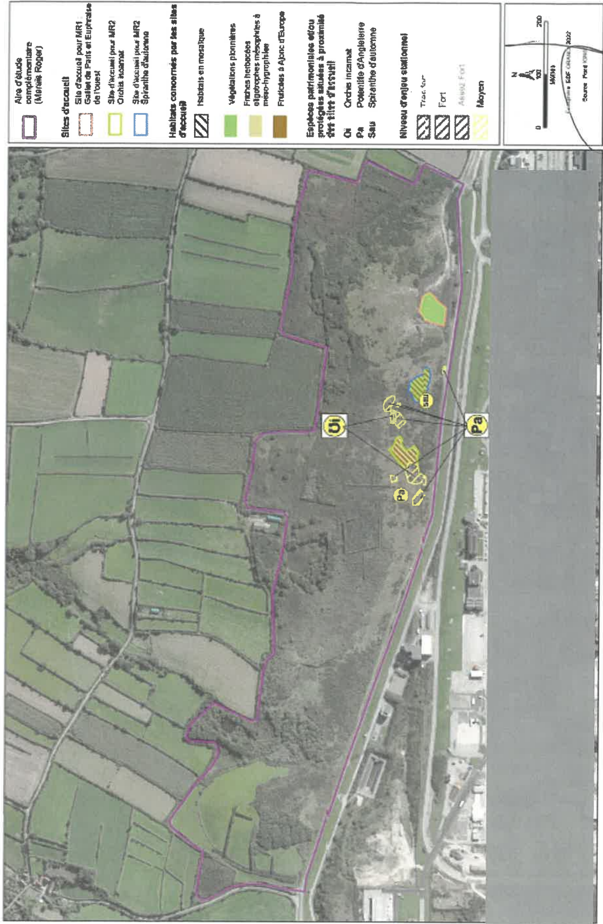
Figure 1: Localisation de l'Euphrase de l'Ouest, de l'Orchis incarnat et de la Spiranthé d'automne