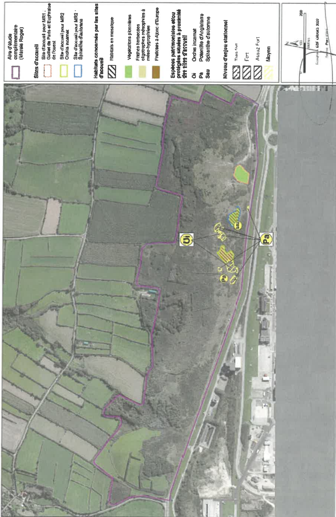
Figure 1: Localisation des semis de Gaillet de Paris