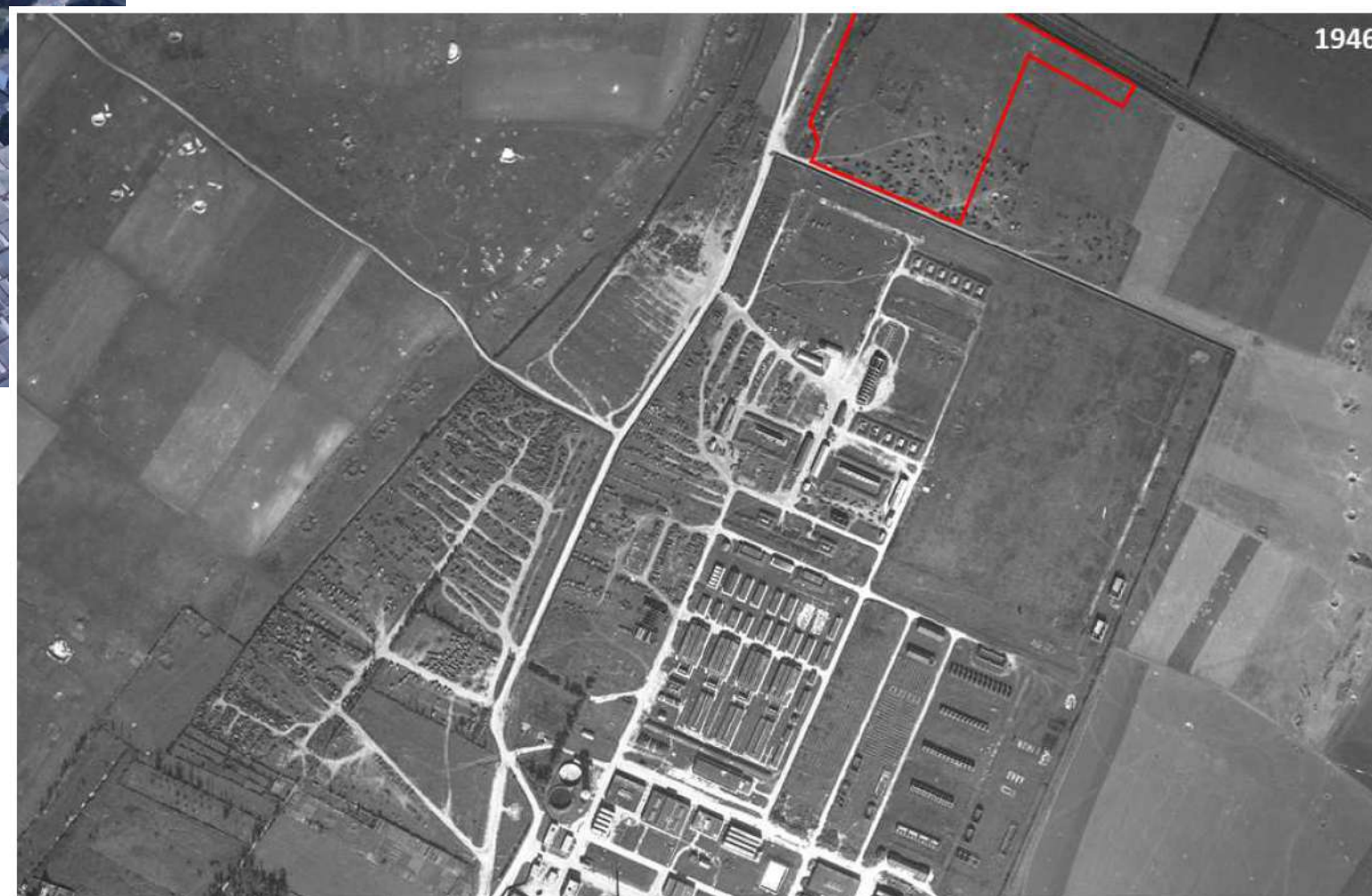
Vue aérienne du site en 1946