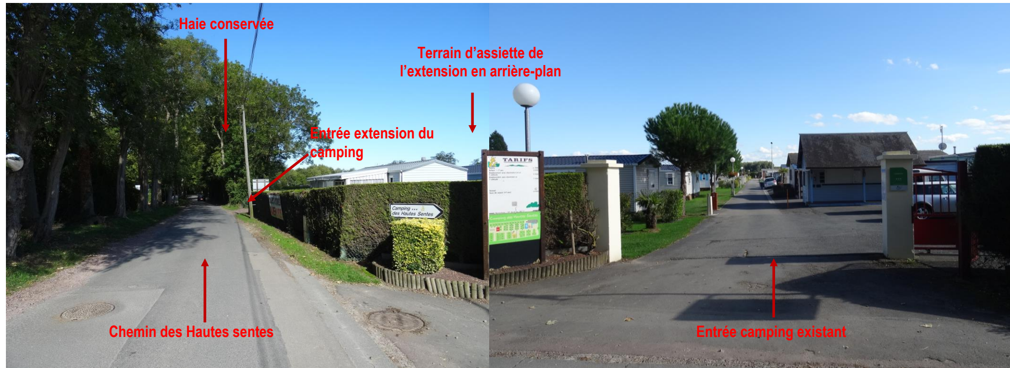
Vue depuis le chemin des Hautes Sentes