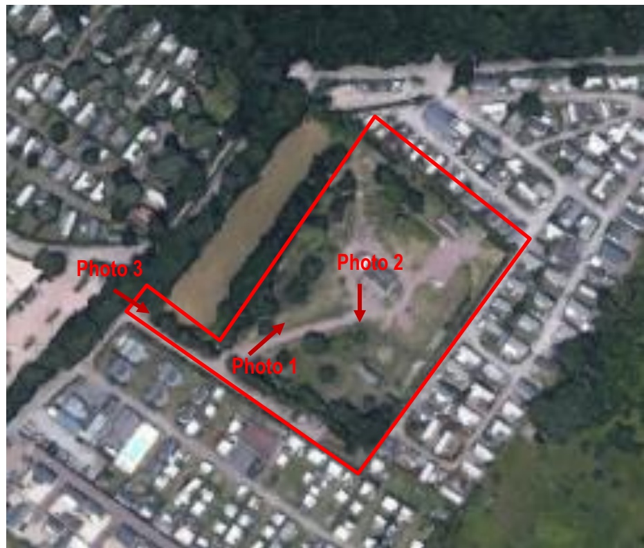
Vue aérienne – extrait google earth – sans échelle