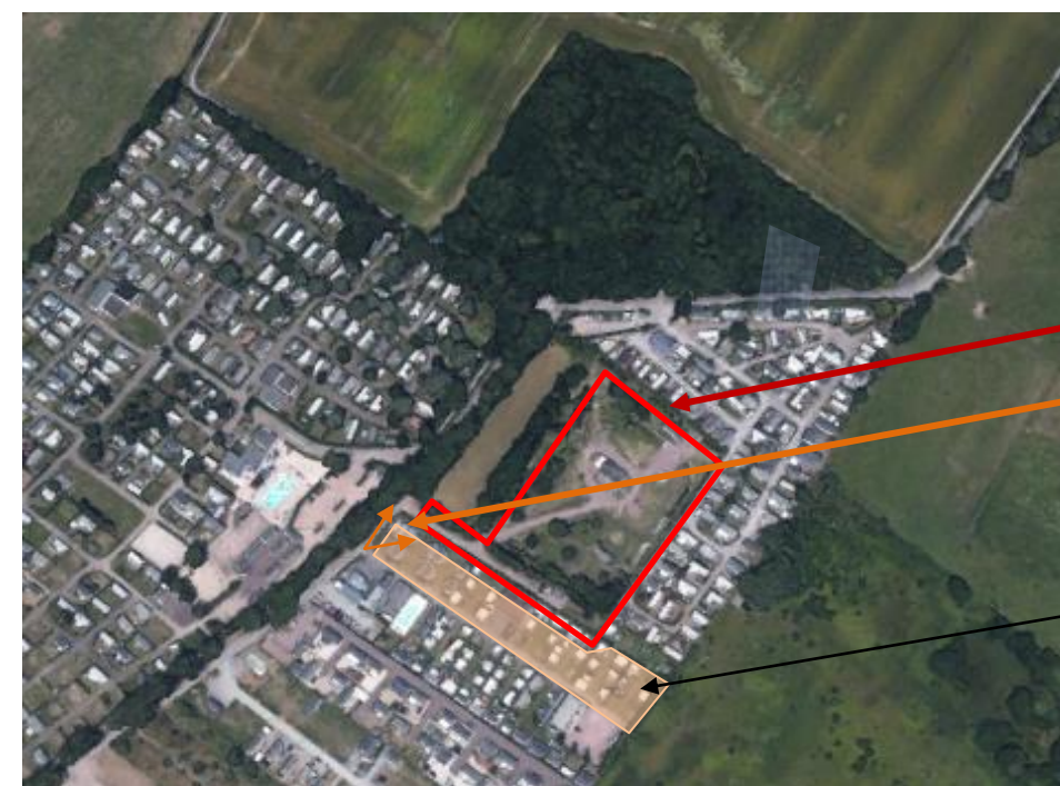
Vue aérienne – extrait google earth – sans échelle