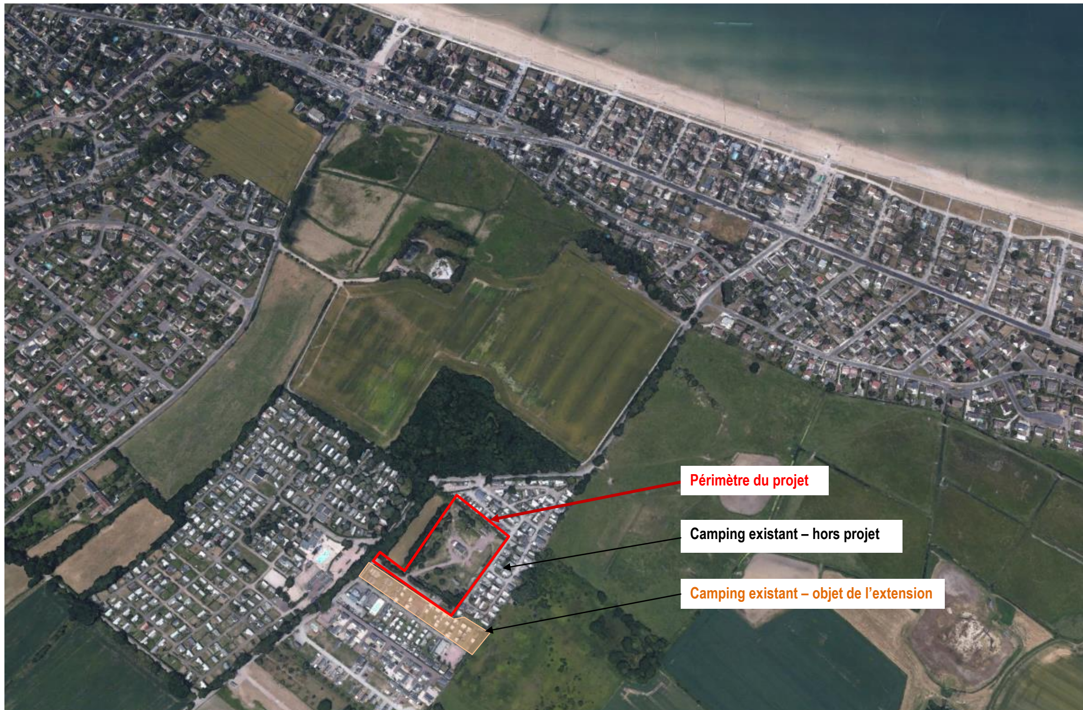
Vue aérienne – extrait google earth – sans échelle

Vue depuis aérienne permanent d'appréhender la situation du projet dans le paysage lointain