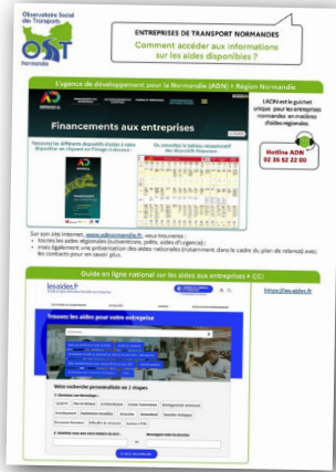
Plaquette précisant aux entreprises de transport normandes comment accéder aux informations sur les aides disponibles et qui contacter lorsqu'elles rencontrent des difficultés

Tableau de bord annuel du transport routier présentant notamment les données régionales relatives au trafic, à l'accidentologie, à l'emploi, à la formation et aux registres des transports