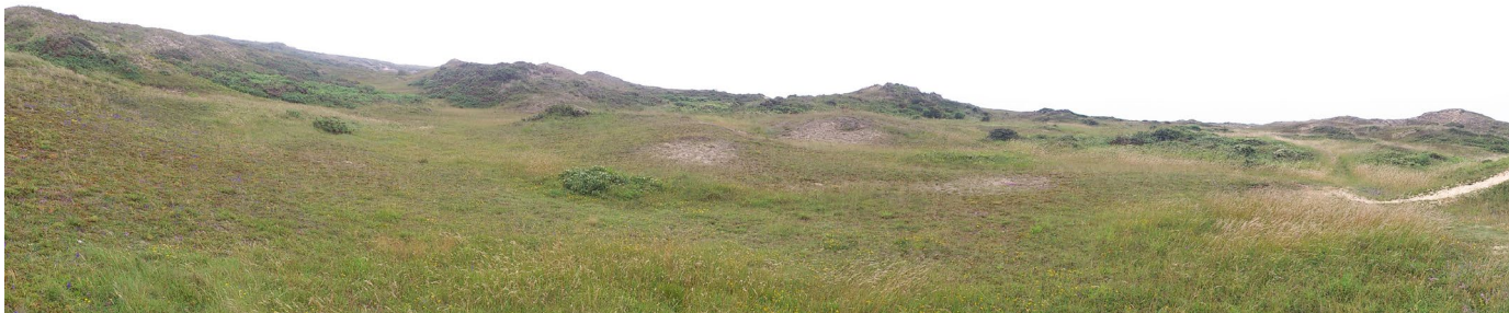
Réserve naturelle nationale de la Mare de Vauville : projet d'extension dans le plan d'actions régional SAP

La loi « climat et résilience » du 22 août 2021 a inscrit la stratégie nationale pour les aires protégées (SAP) dans le code de l'environnement. Celle-ci porte sur les milieux marins et terrestres.