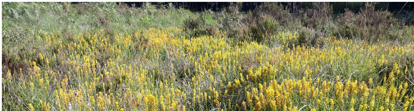
Tourbière de la réserve biologique d'Écouves créée en 2021

Le plan d'actions 2022-2024 sera évalué à son terme et le bilan réalisé sera présenté au Comité régional biodiversité (CRB) de Normandie ainsi qu'au conseil scientifique régional du patrimoine naturel (CSRPN). Un nouveau plan d'action sera élaboré pour la période 2025-2027.