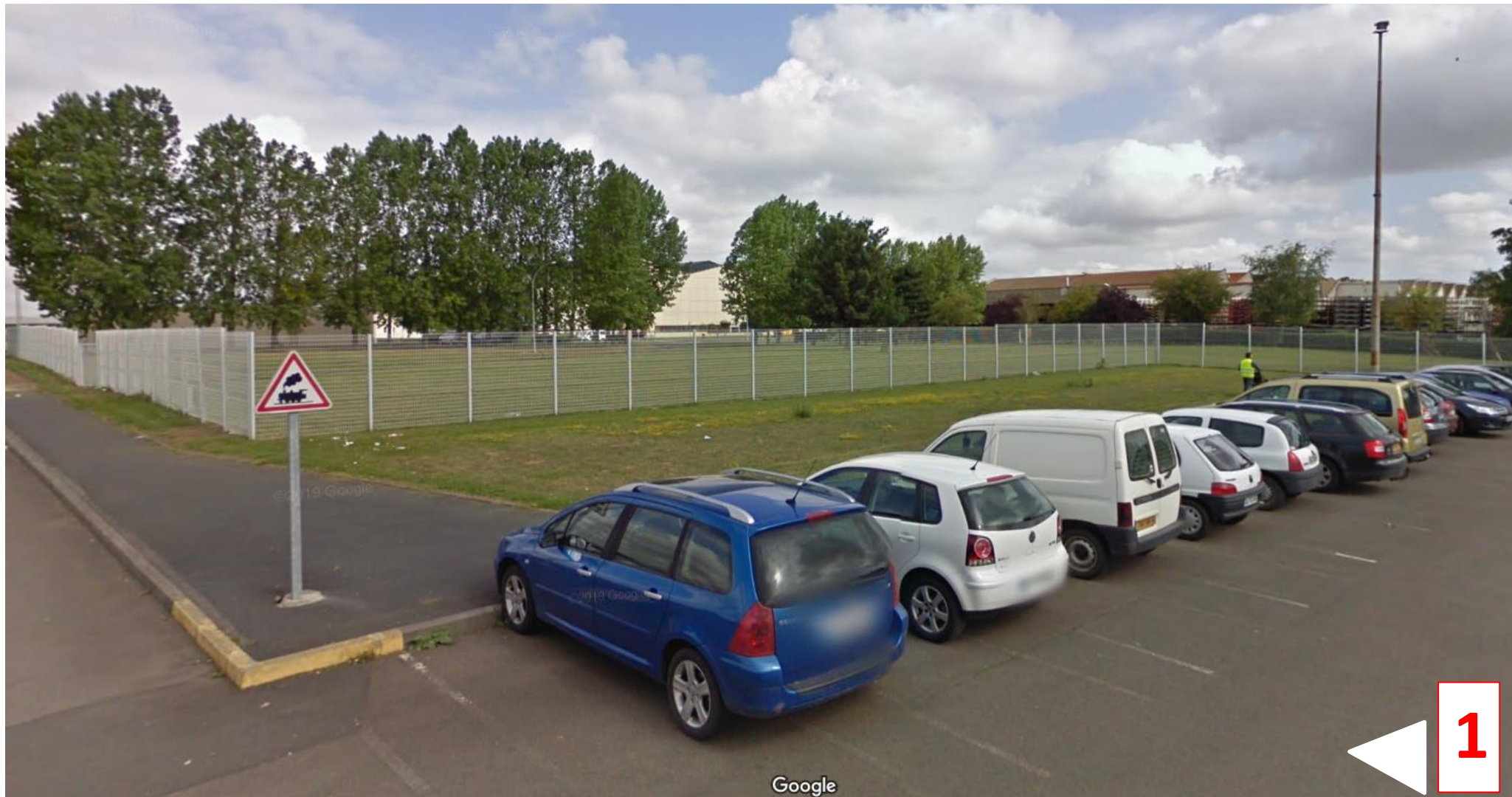
Vue du site d'étude