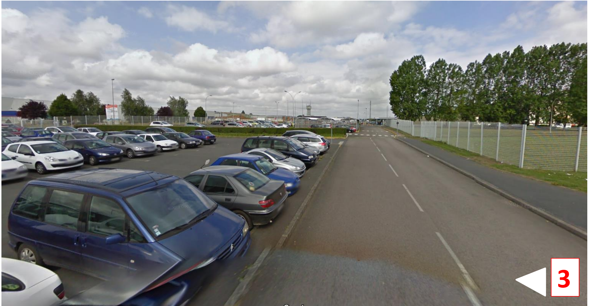
Vue des secteurs déjà aménagés en parking dans l'emprise du site