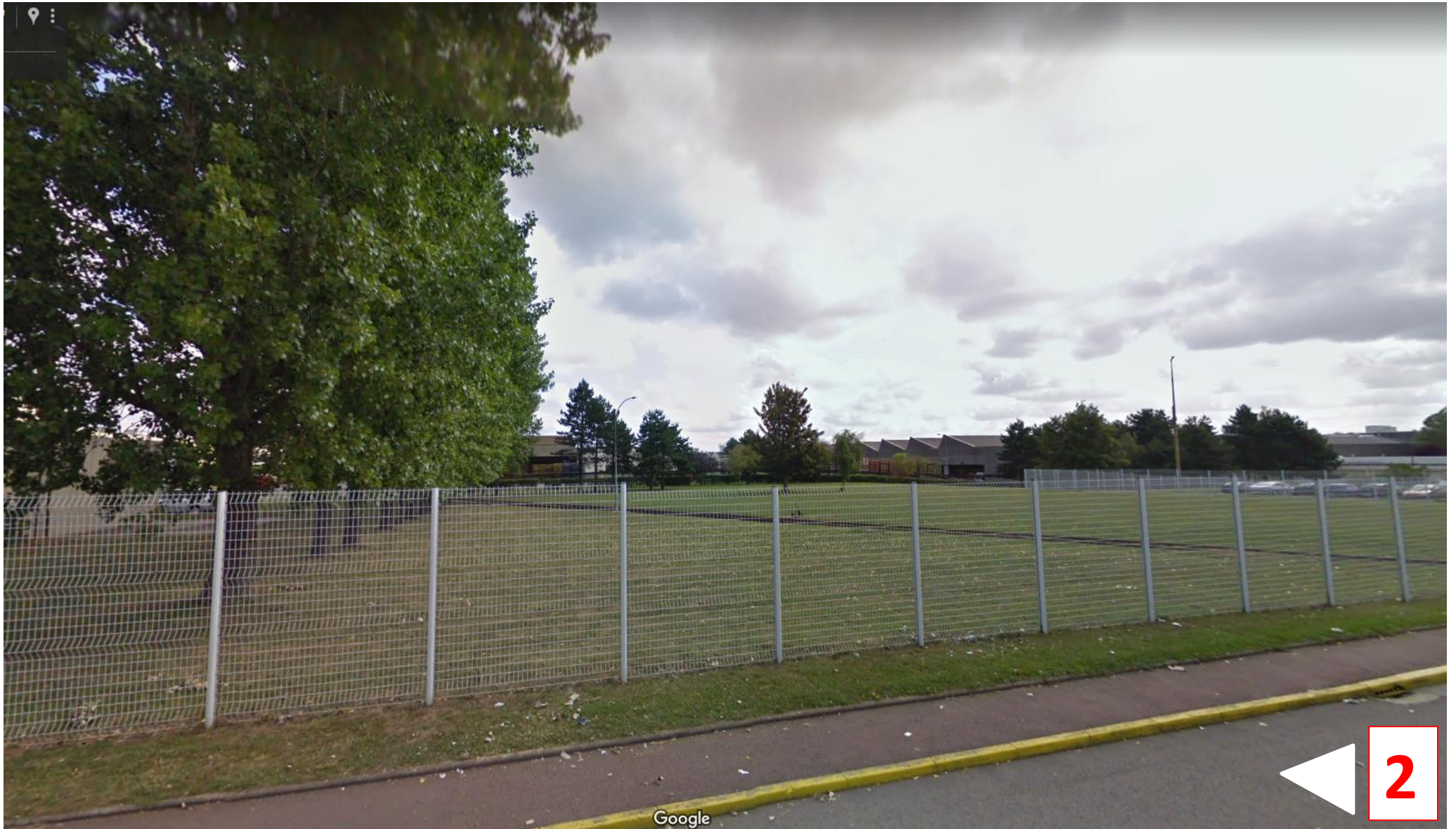
Vue de l'alignement de peupliers présent dans le site