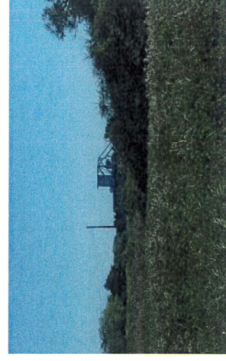
Le Pegasus Bridge