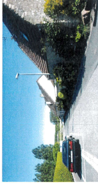
Rue du Bac du Port