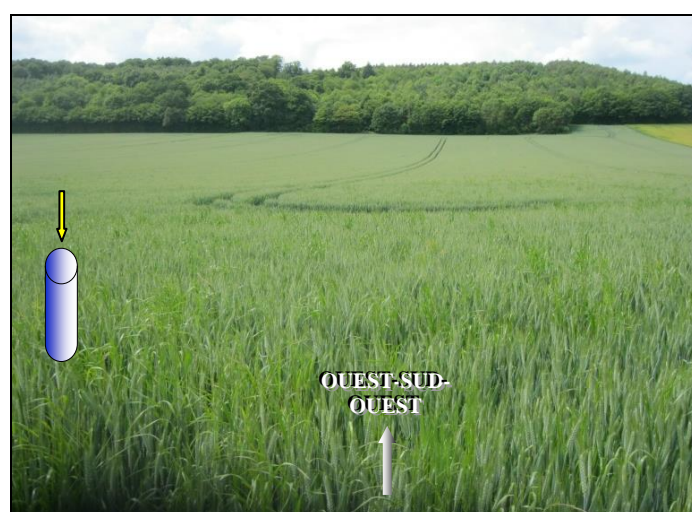
Vues du point d'implantation et aperçu de l'environnement du forage projeté près du lieu-dit du VILLAGE (LA HAYE-LE-COMTE – 27) (Photographies : GéoSen – 29-mai-19)