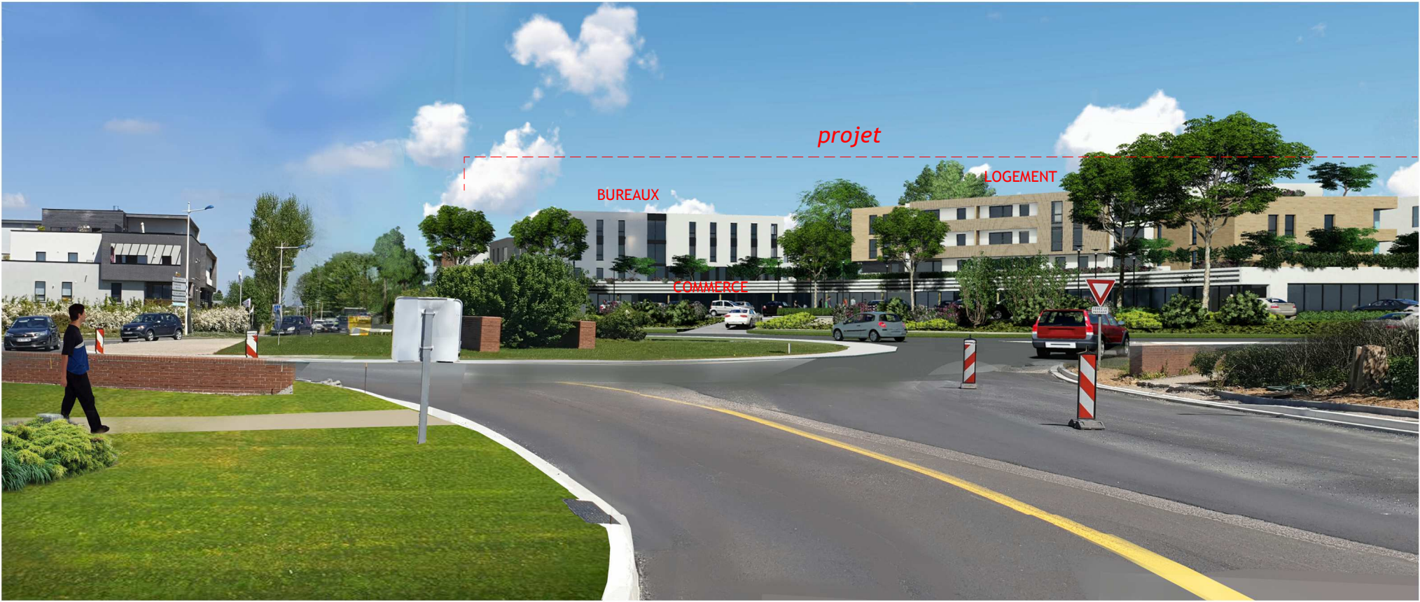
vue 3 - route de neufchatel - depuis Rouen