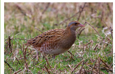
Râle des genêts ( Crex crex )

Oiseaux reproducteurs :Râle des genêts, Chouette chevêche, Rougequeue à front blanc, Faucon hobereau, Tarier des prés, Bergeronnette printanière, Vanneau huppé, Locustelle tachtée, Rousserolle effarvatte, Bouscarle de Cetti, petit Gravelot, Aigrette garzette Nombreux oiseaux en escale hivernale - mammifères :Musaraigne aquatique, Campagnol amphibie, chauves-souris (grand Rhinolophe, grand Murin, Murin à oreilles échancrées), ... - amphibiens et reptiles : Crapaud calamite, Triton crêté, Vipère péliade, ... - insectes : Pique-Prune, Ecaille chinée