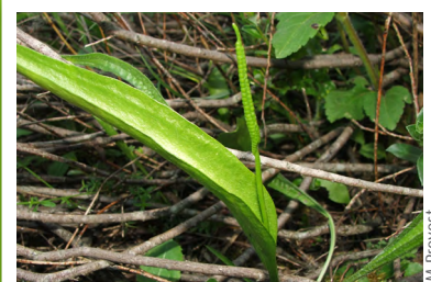
Ophioglosse vulgaire ( Ophioglossum reticulatum )