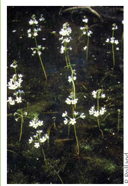
Hottonie des marais ( Hottonia palustris )

Oenanthe à feuilles de Silaus, Oenanthe fistuleuse, Sénéçon aquatique, Colchique des prés, Euphorbe des marais, Orge faux-seigle, Brome rameux, Grande Glycérie, Laïche distique, Centaurée noire, Ophioglosse vulgaire, Hottonie des marais, Oenanthe à feuille de Peucedan, Guimauve officinale, Oenanthe safranée, Cardamine impatiente, Petite Centaurée, Saule fragile