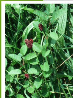
Sanguisorbe officinale ( Sanguisorba officinalis )