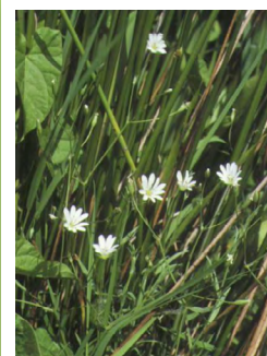
Stellaire des marais ( Stellaria palustris )

Les zones de prairies les plus humides renferment un cortège végétal adapté. Parmi les espèces les plus remarquables, citons plus particulièrement les deux variétés de la Laïche queue-de-Renard, la Renoncule divariquée, la Stellaire des marais, l'Orchis négligé, la Sanguisorbe officinale, espèce protégée au niveau régional.