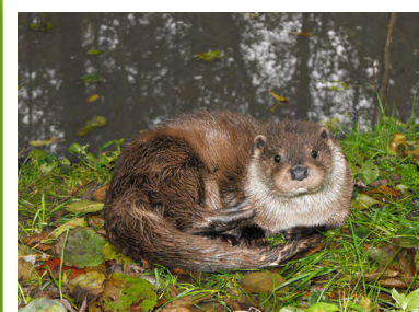
Loutre d'Europe ( Lutra lutra )

Ces prairies humides constituent l'un des principaux sites de nidification du Courlis cendré dans le département. La Loutre d'Europe est présente du fait de la présence de nombreux habitats favorables à son développement.