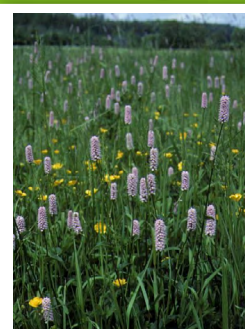
Renouée bistorte ( Persicaria bistorta )