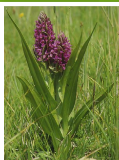
Orchis incarnat ( Dactylorhiza incarnata )