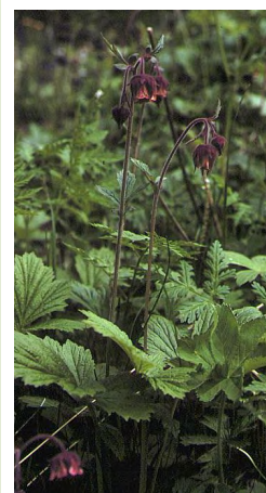
Benoîte des ruisseaux ( Geum rivale )

Le climat à affinités montagnardes de ce secteur du Perche ornais est à l'origine de la présence de la Renouée bistorte et de la Benoîte des ruisseaux.