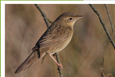
Locustelle tachetée ( Locustella naevia )

Les chants de la Locustelle tachetée et du Bruant des roseaux y sont réguliers et indiquent leur reproduction. Le lézard vivipare y a été observé.