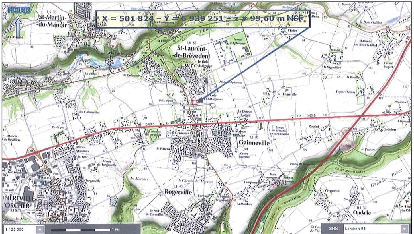
Situation du forage projeté à LA CÔTE DES CHÂTAIGNIERS (GAINNEVILLE – 76) sur un extrait de carte topographique de l'IGN à 1/25 000°