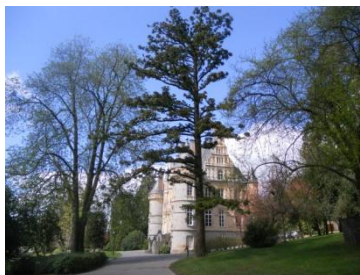
Atelier mutualisé des 2 CdC organisé à Bagnoles-de-Orne le 16/04/2018

L'ensemble du groupe ainsi constitué a pu rassembler à la fois des élus dont une partie sont des agriculteurs, des techniciens des communautés de communes ainsi que des représentants de la Chambre d'Agriculture.