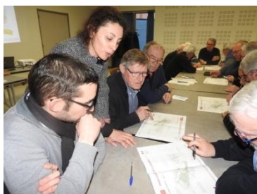
Atelier exploratoire de la CdC Andaines-Passais, organisé à Juvigny-sous-Andaine, le 06/03/2018

Nb : les intitulés retenus pour les CDC sont ceux effectifs au 01 er janvier 2017