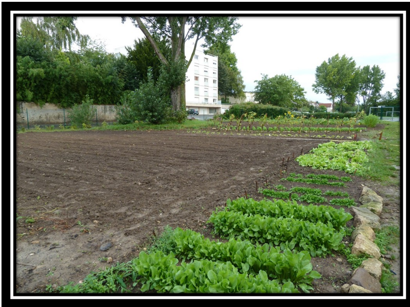
Vue d'ensemble du jardin : côté Montmorency - rue des Sources