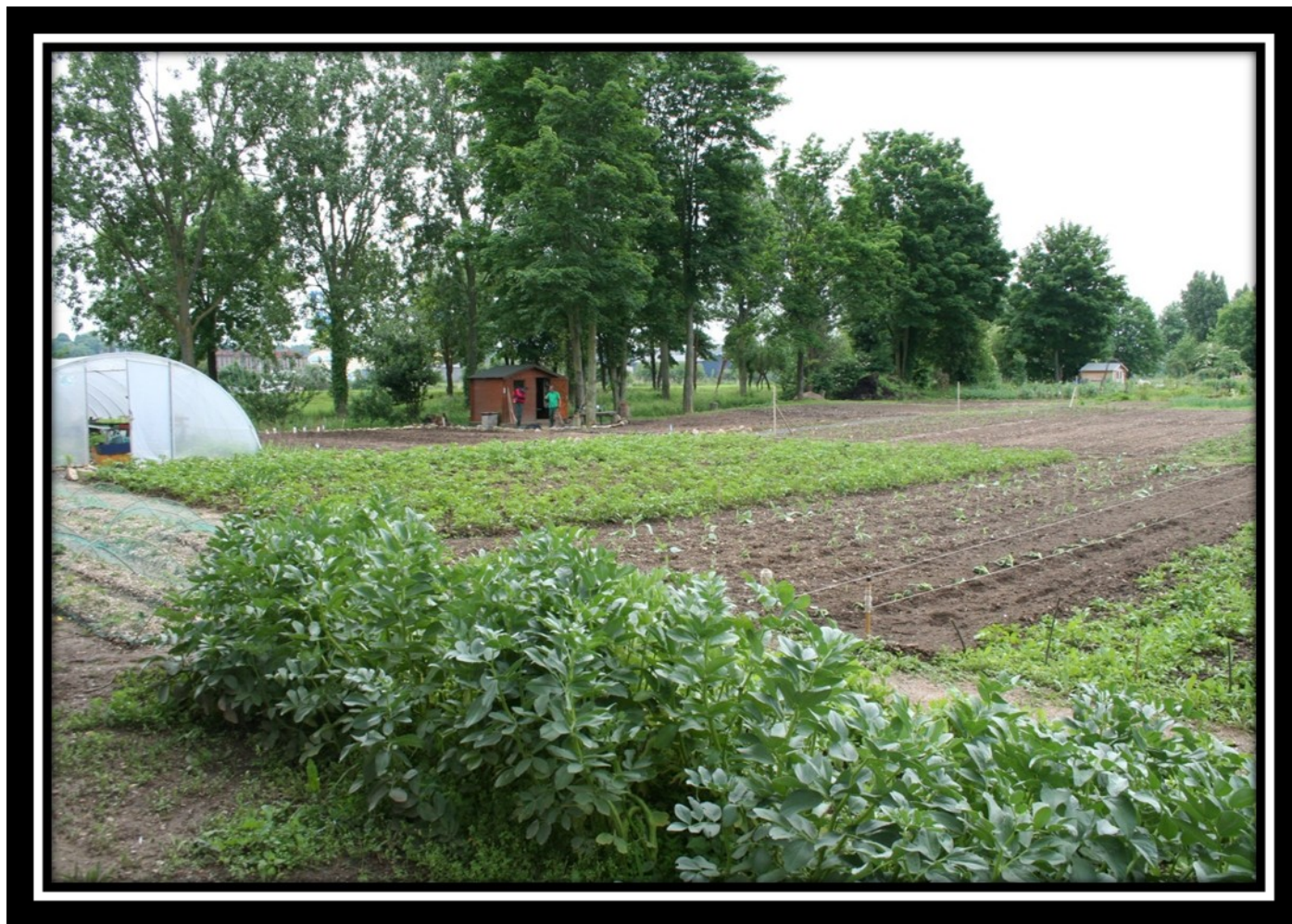
Vue d'ensemble du jardin : côté Canal de Caen à la mer