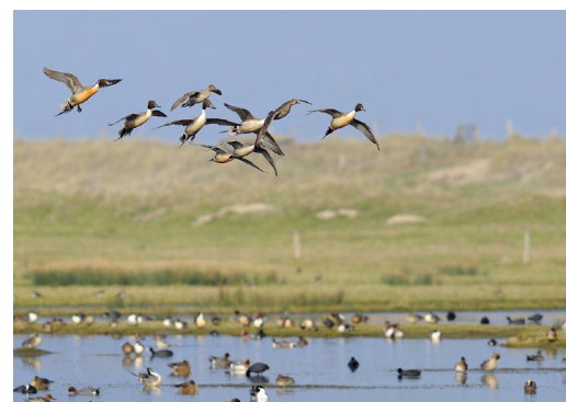
Un bel exemple de polder réhabilité en vue d'accueillir des oiseaux