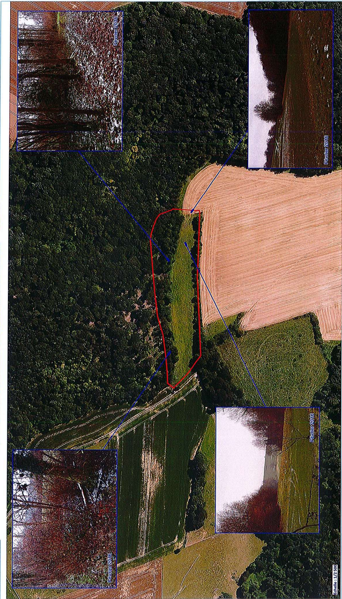
Annexe 3 - Site d'implantation du projet d'ouvrage B2