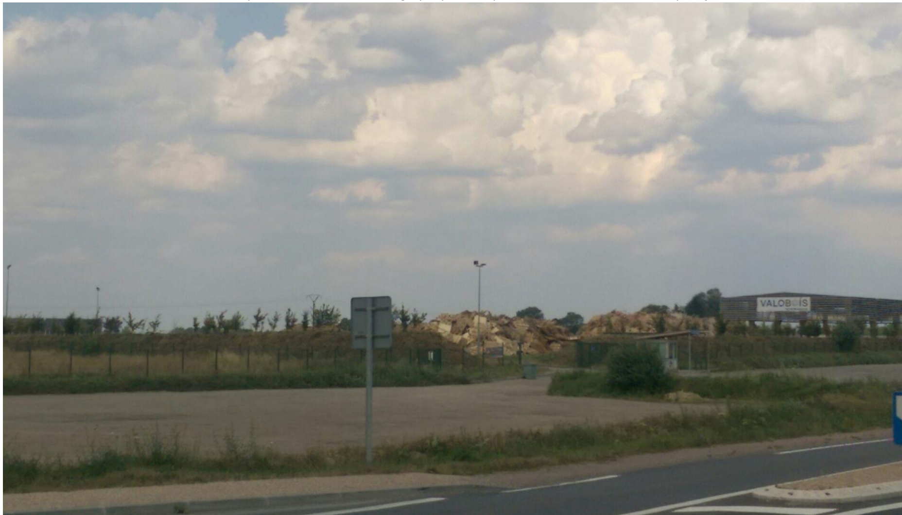
Photo #1 : Situation dans l'environnement proche ; Localisation cartographique de la prise de vue : entrée (sud) de la plateforme, vers les Nord-Est