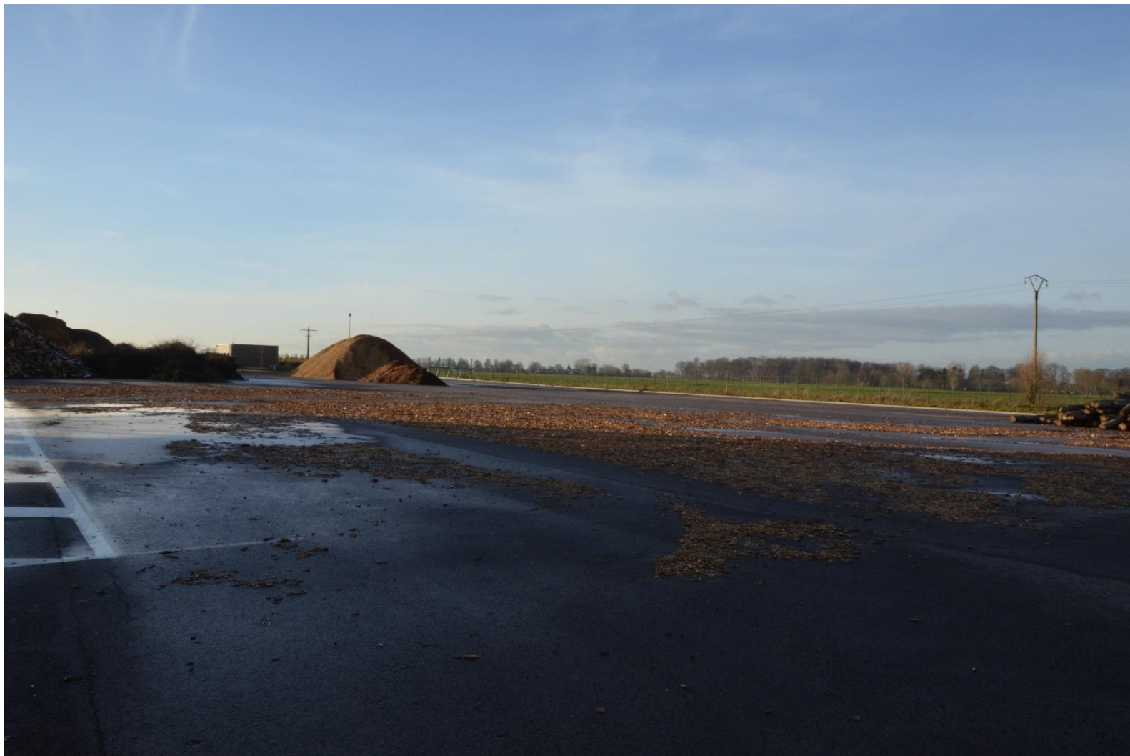
Photo #2 : Situation dans le paysage lointain ; Localisation cartographique de la prise de vue : partie Est de la PF, vers le Nord-Ouest