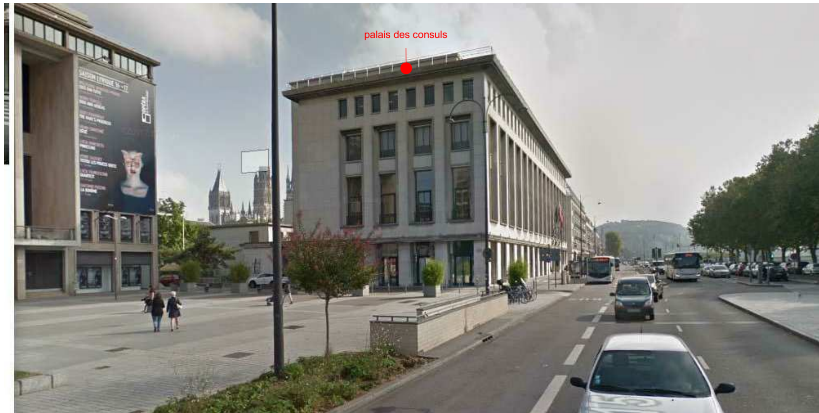
QUAI DE LA BOURSE