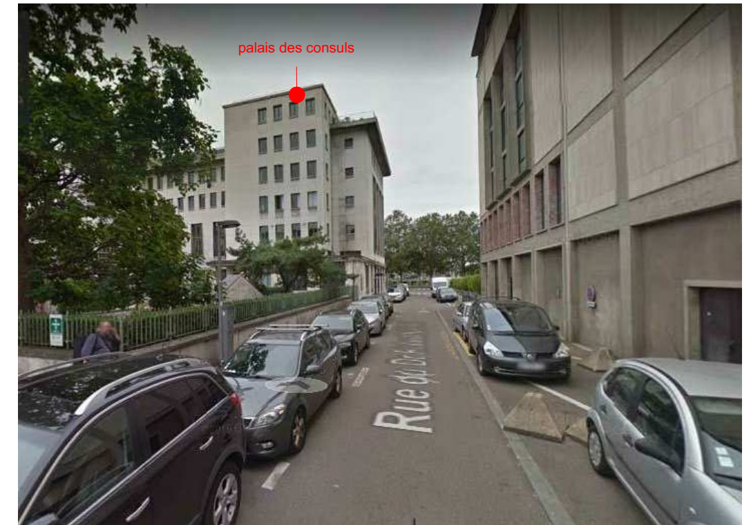
rue du docteur Rambert