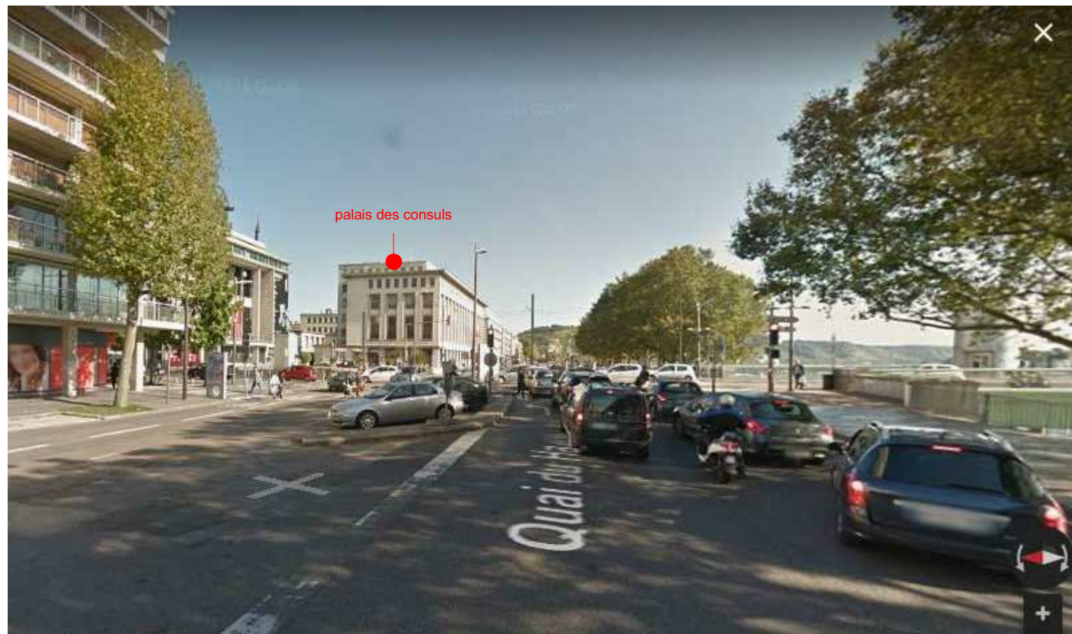
le quai de la bourse depuis depuis le pont Jeanne d'Arc