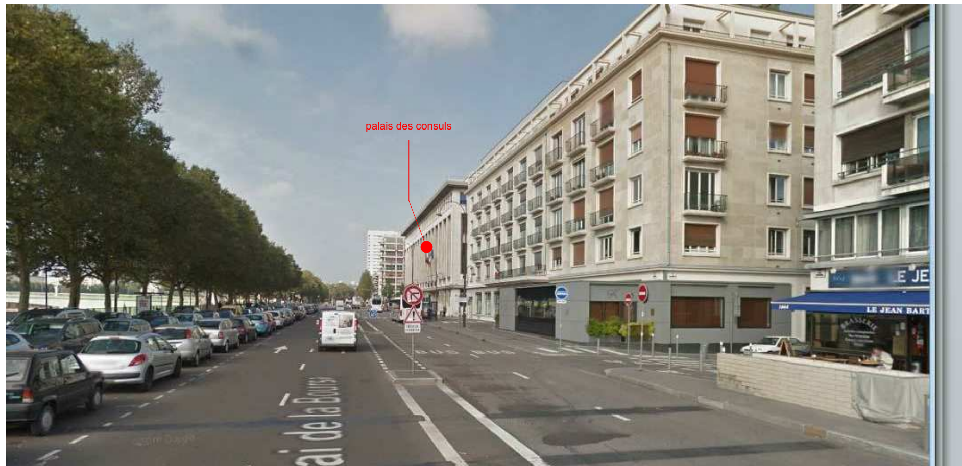
le quai de la bourse depuis depuis le pont Boieldieu