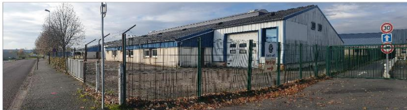
Vue Piétonne 2

Plan de repérage photographique et insertions