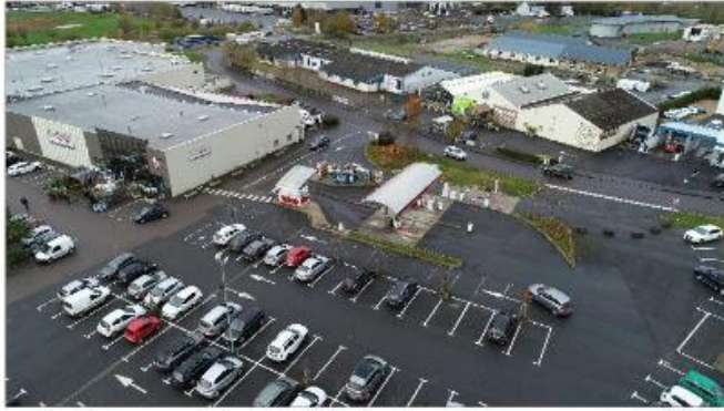
Vue Aérienne 1