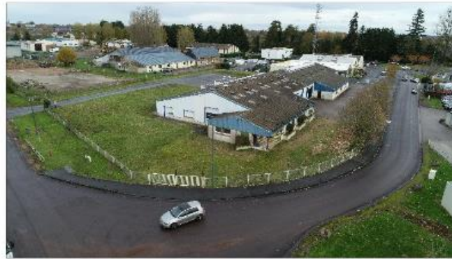
Vue Aérienne 2