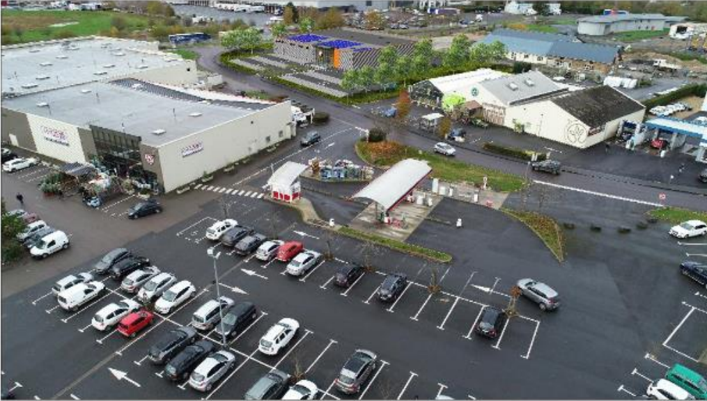
Vue Aérienne 1