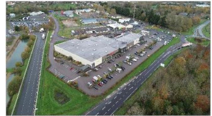
Vue Aérienne 3