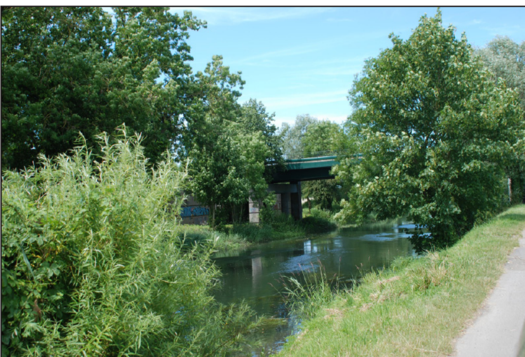
Les berges de la Bresle offrent une image très naturelle....