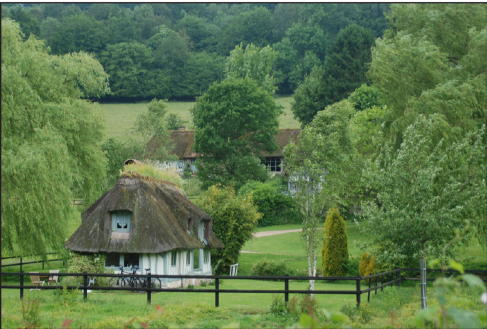
Chaumière normande dans la vallée de la Rançon, un patrimoine bâti rural à préserver.