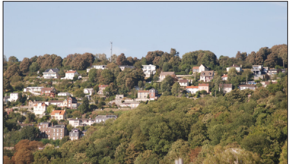
Les coteaux urbanisés de la Seine à Rouen : la ligne de crête boisée, la forte présence végétale ainsi que l'étagement du bâti sont les composants essentiels pour que le coteau reste un paysage de qualité.