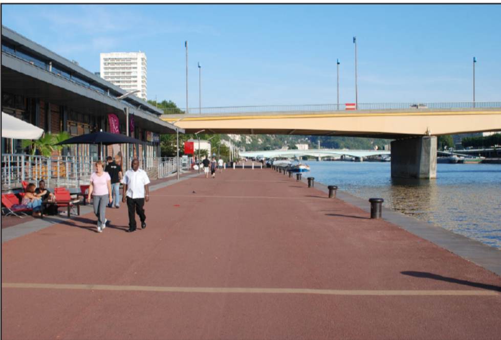
Les nouveaux aménagements sur les bords de Seine à Rouen permettent aux rouennais de redécouvrir leur fleuve. Même très minéralisés, ces quais amorcent une continuité (visuelle pour le moment) entre la côte Sainte-Catherine et les coteaux de Canteleu.