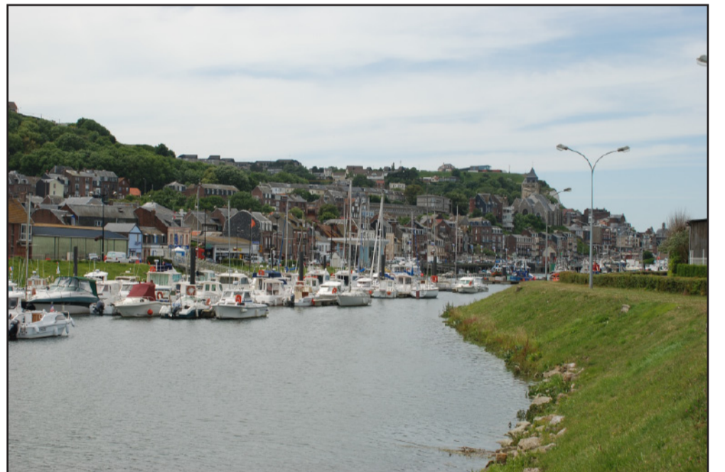
Avec le port de plaisance au coeur de la ville, Saint-Valéry-en-Caux conserve une continuité des espaces naturels entre la vallée et la mer.