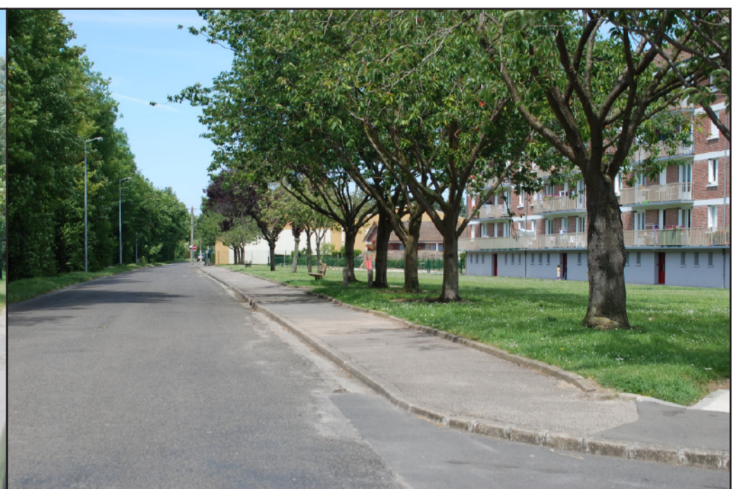
...en plein coeur d'un quartier urbain de la ville d'Eu.