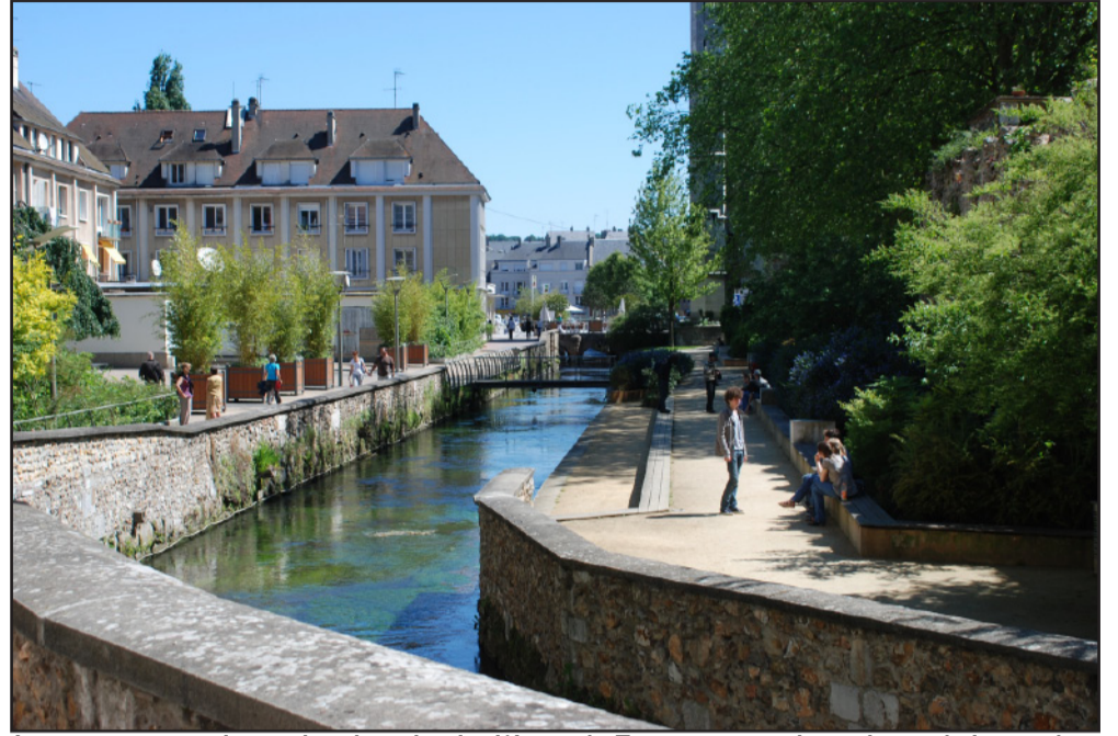
La mise en valeur des bords de l'Iton à Evreux a redonné vie à la rivière dans la ville.