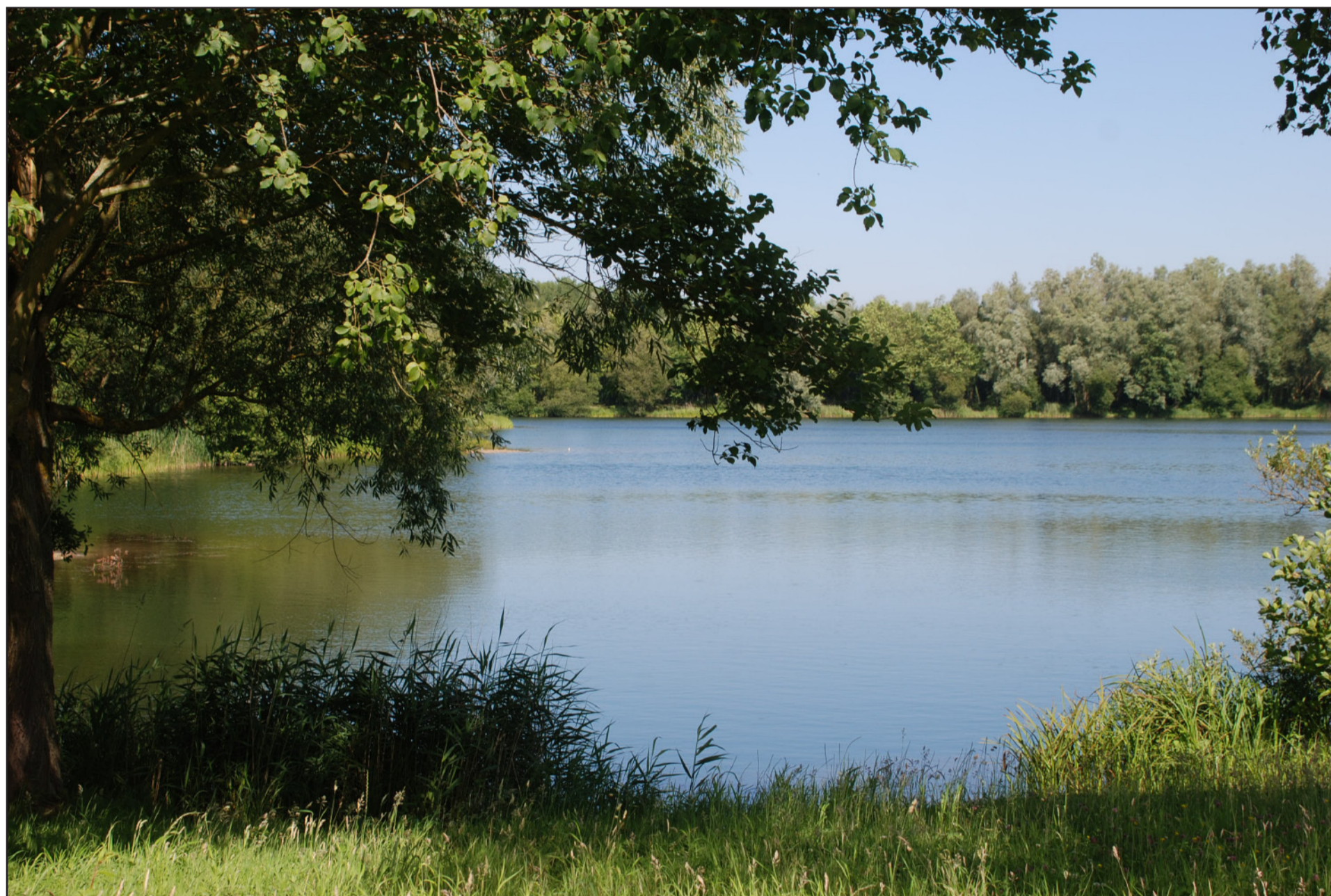
Etang de la Bresle : une reconquête naturelle des berges.