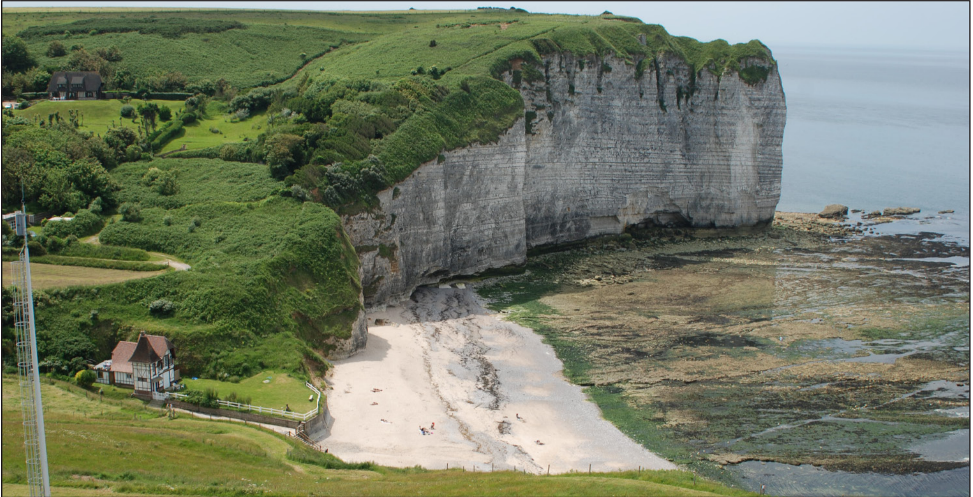
Plage de Vaucottes : une plage qui a su préserver ses espaces naturels grâce au site classé dont elle a fait l'objet.