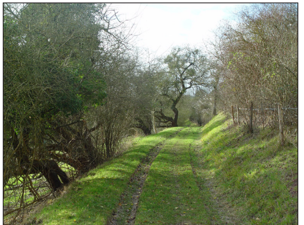
Un cheminement sur le coteau au-dessus de Giverny : une promenade qui offre des vues séquentielles sur la vallée.