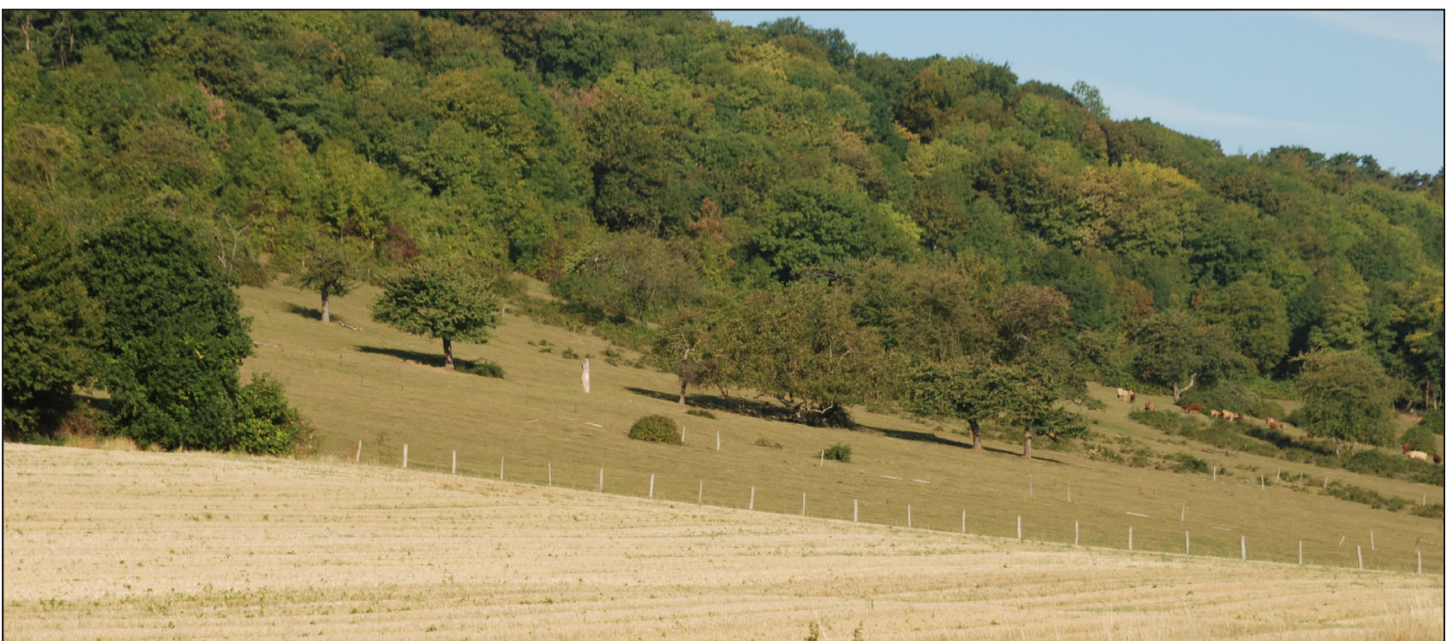
Une gestion composée du coteau de Vernon : boisements sur les pentes raides, prés-vergers sur les pentes moyennes et cultures sur les pentes douces. Un paysage équilibré entre espaces ouverts et espaces boisés.