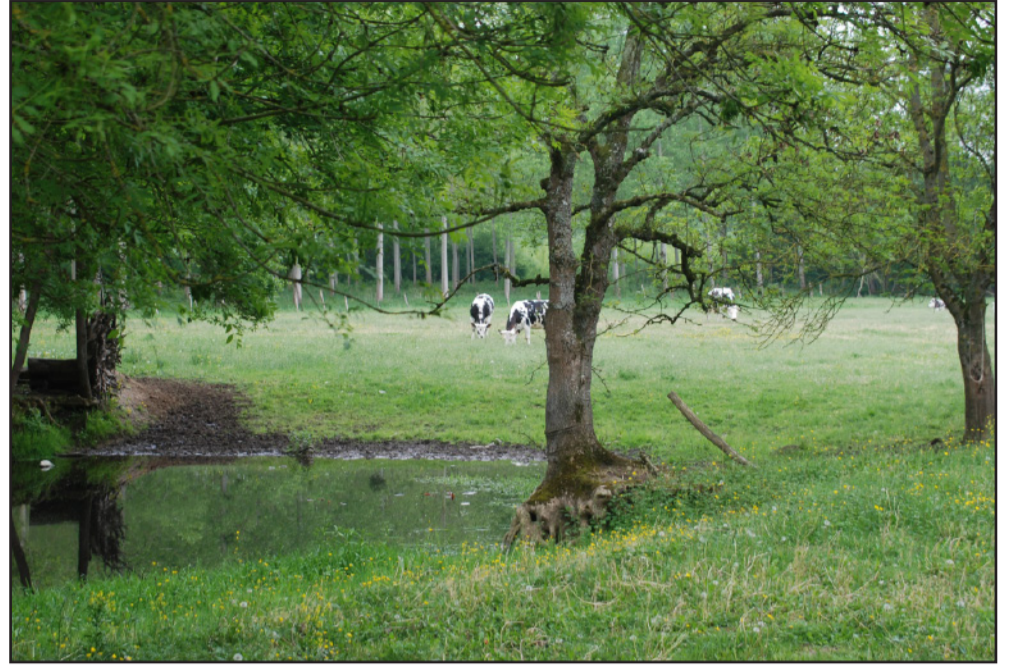
Mare et prairies humides pâturées, révèlent la vocation naturelle de ce fond de vallée.