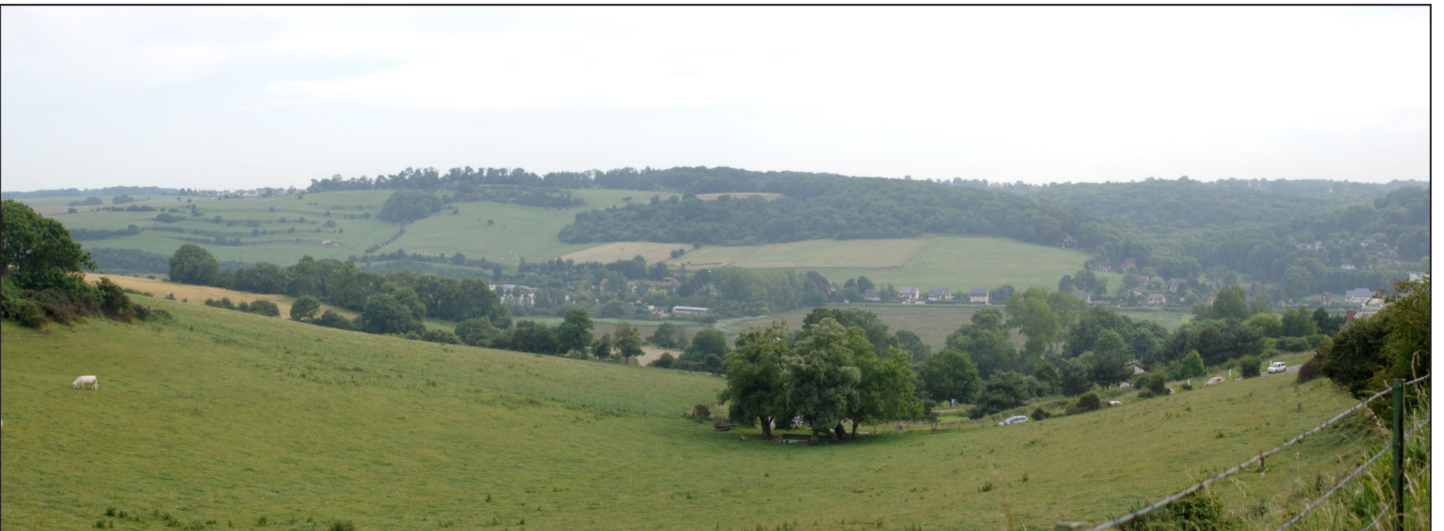
Vallée de la Scie à Pourville-sur-Mer : un équilibre harmonieux à maintenir entre espaces naturels, espaces agricoles et espaces bâtis.