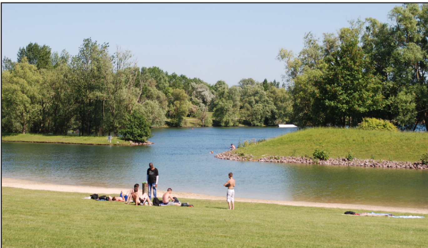
Plage de baignade du lac des Deux-Amants : un aménagement sobre qui laisse des secteurs de reconquête naturelle.