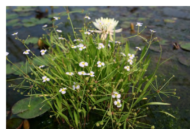
Flûteau fausse renoncule ( Baldellia ranunculoides )