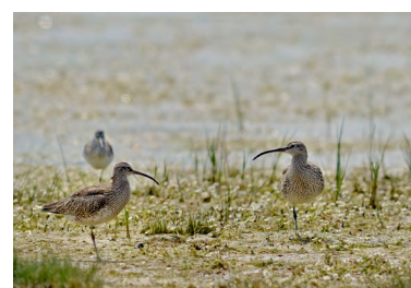
Courlis cendré ( Numenius arquata )

Cette zone joue un rôle important en hiver car elle constitue une zone d'escale et d'alimentation pour certaines espèces. Des contingents importants de Courlis cendré, de Vanneaux ont été notés sur cette zone en cas de vague de froid.