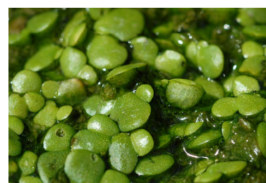
Lentille gibbeuse ( Lemna gibba )