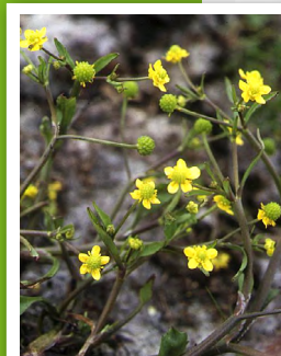
Butome ( Butomus umbellatus )