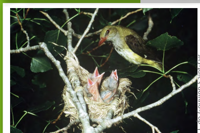
Lorient d'Europe ( Oriolus oriolus )