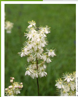
Filipendule ( Filipendula )