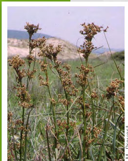
Marisque ( Cladium mariscus )

Cette zone renferme une flore caractéristique, riche de quelques espèces rares et/ou protégées au niveau régional, tels le Marisque, la Lentille à plusieurs racines, le Pigamon jaune, l'Orchidée à deux feuilles, le Choin noirâtre, l'Hottonie des marais, la Berle érigée, le Potamot coloré, le Rubanier nain, le Scirpe pauciflore, le Myriophylle verticillé, le Filipendule