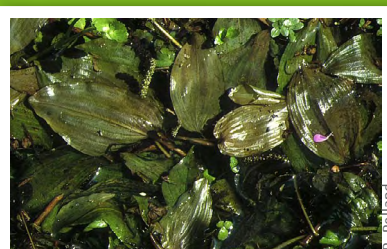
Potamot coloré ( Potamogeton coloratus )