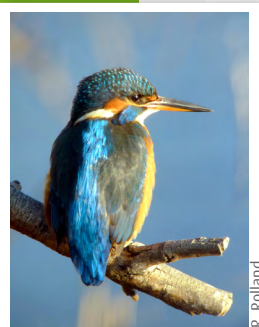
Martin-pêcheur ( Alcedo atthis )

Ce site accueille également de nombreux oiseaux en escale migratoire tels le Phragmite aquatique, le Bruant des roseaux, la Spatule blanche...et de nombreux échassiers et anatidés