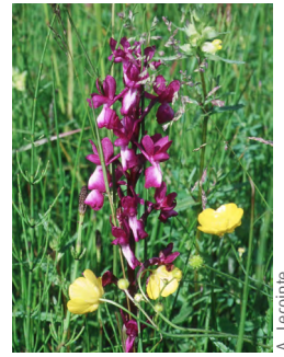
Orchis à fleurs lâches ( Anacamptis laxiflora )