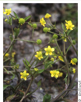
Renoncule à feuille d'ophioglosse ( Ranunculus ophioglossifolius )