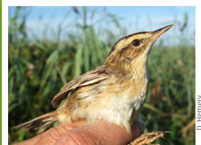
Phragmite aquatique ( Acrocephalus paludicola )