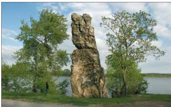
La Pierre Bécherelle, Maine-et-Loire

À la fin du XIX e siècle, des artistes et gens de lettres, ainsi que les premières associations de tourisme et de protection des paysages, prirent conscience de la valeur patrimoniale et de la fragilité des paysages naturels. Alliés à divers mouvements d'opinion opposés aux excès de l'industrialisation, ils favorisèrent l'émergence d'une législation sur la protection des monuments naturels et des sites. Une première loi fut adoptée le 21 avril 1906 puis modifiée et complétée par la loi du 2 mai 1930, aujourd'hui intégrée au code de l'environnement.