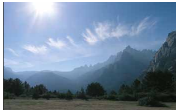
Les Aiguilles de Bavella, Corse-du-Sud

Ces protections n'entraînent pas d'expropriation mais instituent une servitude sur le bien protégé. En site classé, tous les travaux susceptibles de modifier l'état ou l'aspect du site ne peuvent être réalisés qu'après autorisation spéciale de l'État.