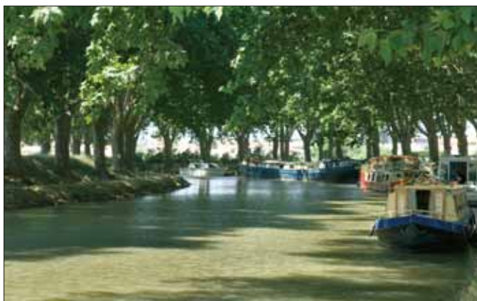
Le Canal du Midi, Aude

Les sites concernés sont des lieux dont le caractère exceptionnel justifie une protection de niveau national. La nature des classements a considérablement évolué avec le temps. Au début, ce sont des éléments remarquables, isolés et menacés de dégradation qui ont été principalement classés – rochers, cascades, fontaines, sources, grottes, arbres... – des points de vue ou belvédères et des châteaux avec leurs parcs. Ensuite, les protections ont progressivement porté sur de plus vastes étendues : massifs, forêts, gorges, vallées,